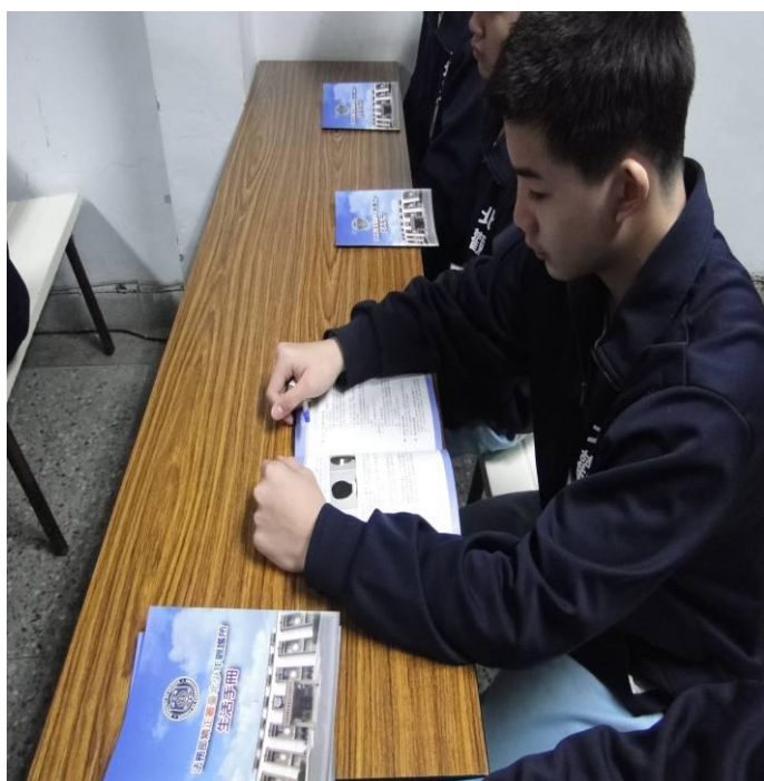
2月份發放生活手冊情形