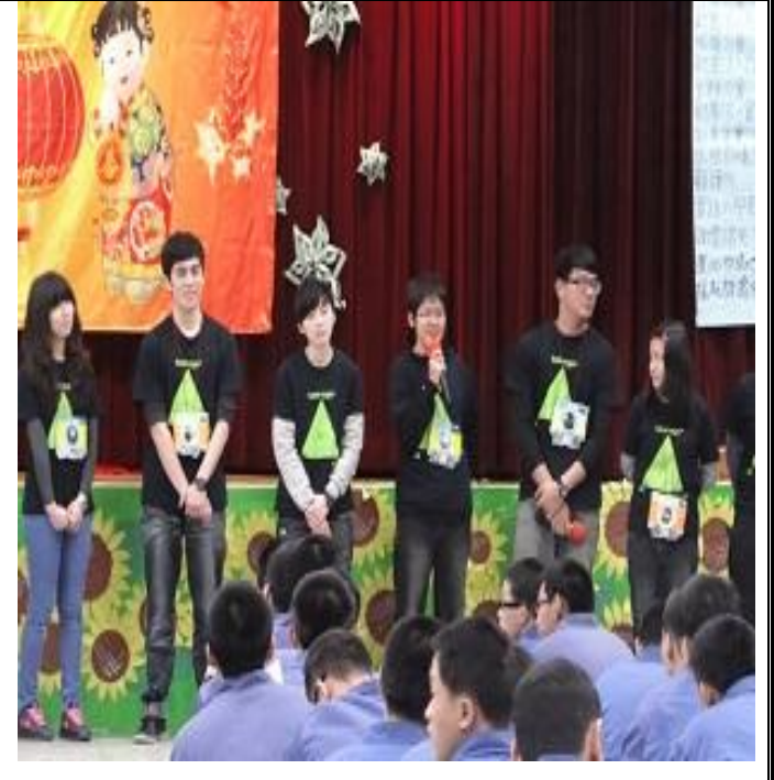
2月13、14、16及17等4日與實踐大學基信少年成長團合辦「寒假成長營」活動