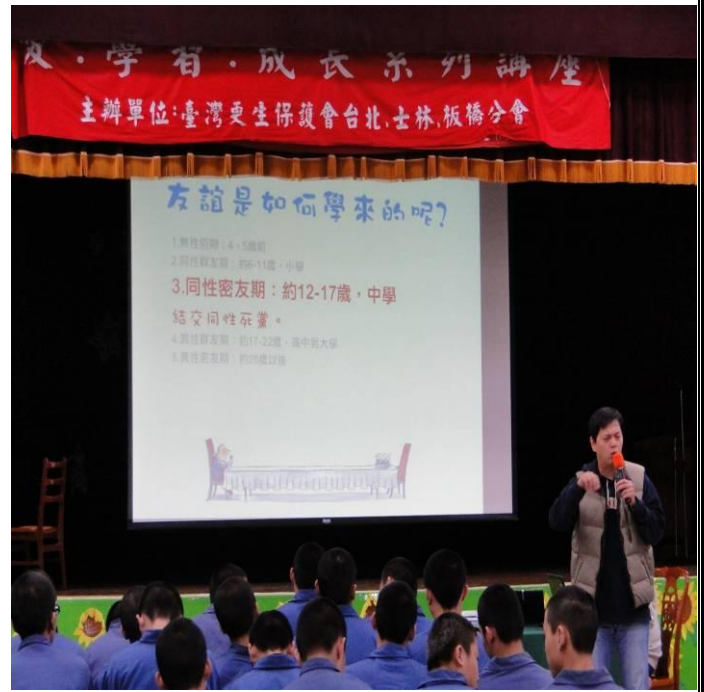
2月15日與更生保護會板橋分會合辦「愛學習成長-家連家，傾聽您聲音」專題演講