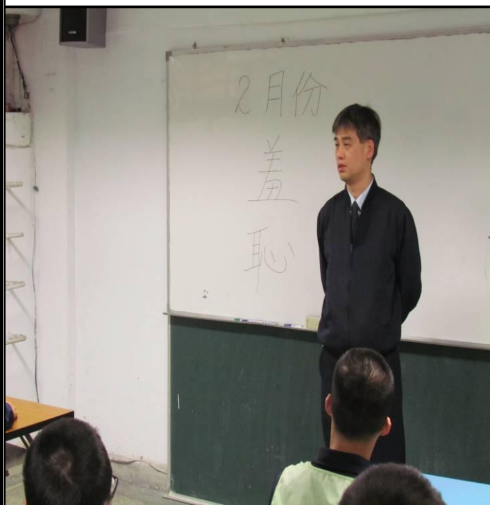
2月14日新收班宣導情形