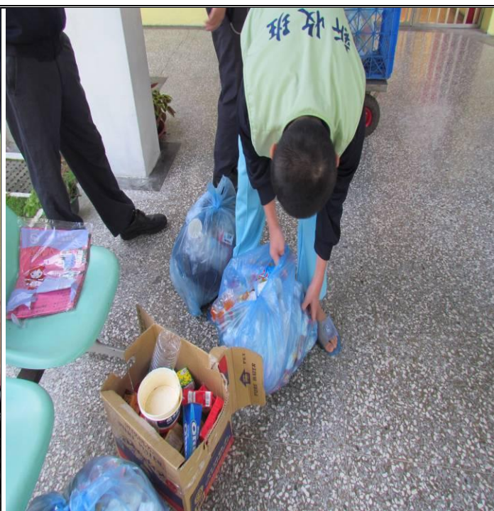
2月份新收班學生資源分類情形