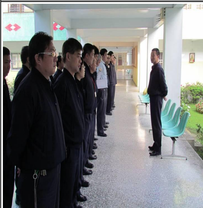
2月8日勤前教育宣導情形