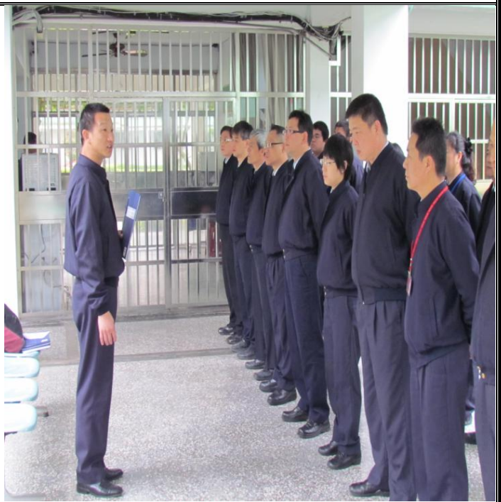
2月3日勤前教育宣導情形