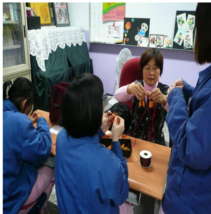
2 月份編織班上課情形