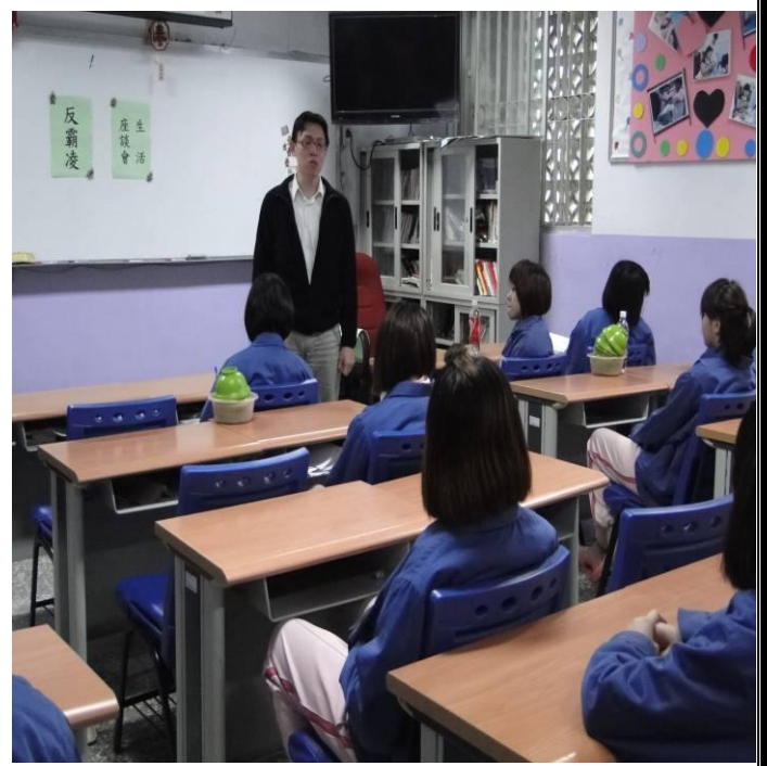
2月23日平班生活座談會宣導