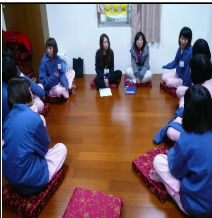
2月份類別輔導情形