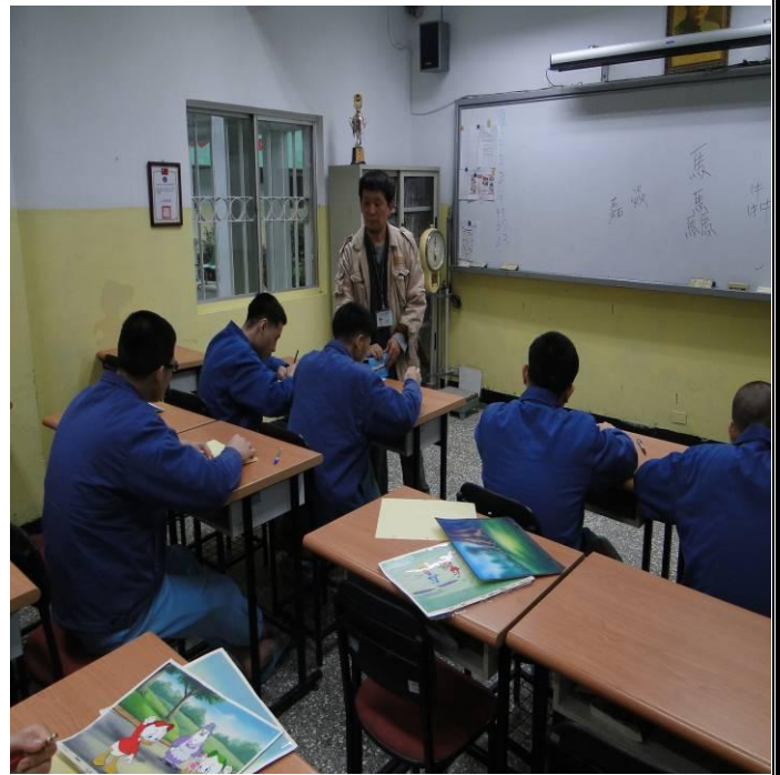
2月20日美術課上課情形