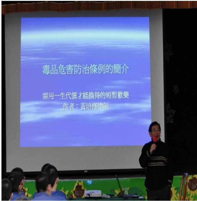
2月8日與賴玉山法律事務所合辦「法律宣導」專題演講