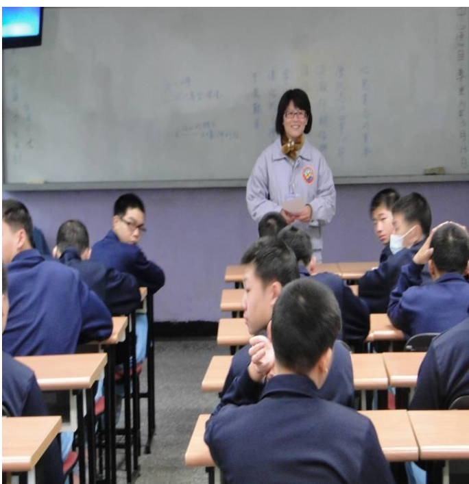
2月24日讀書會之故事導讀