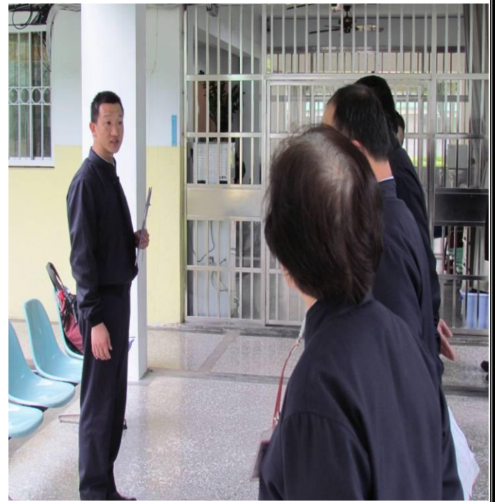
2月11日勤前教育宣導情形