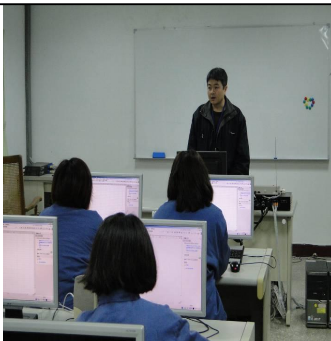
2 月份女生電腦班上課情形