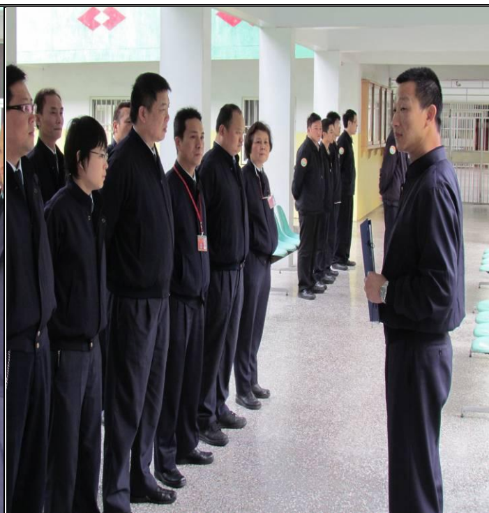
2 月 25 日勤前教育宣導情形