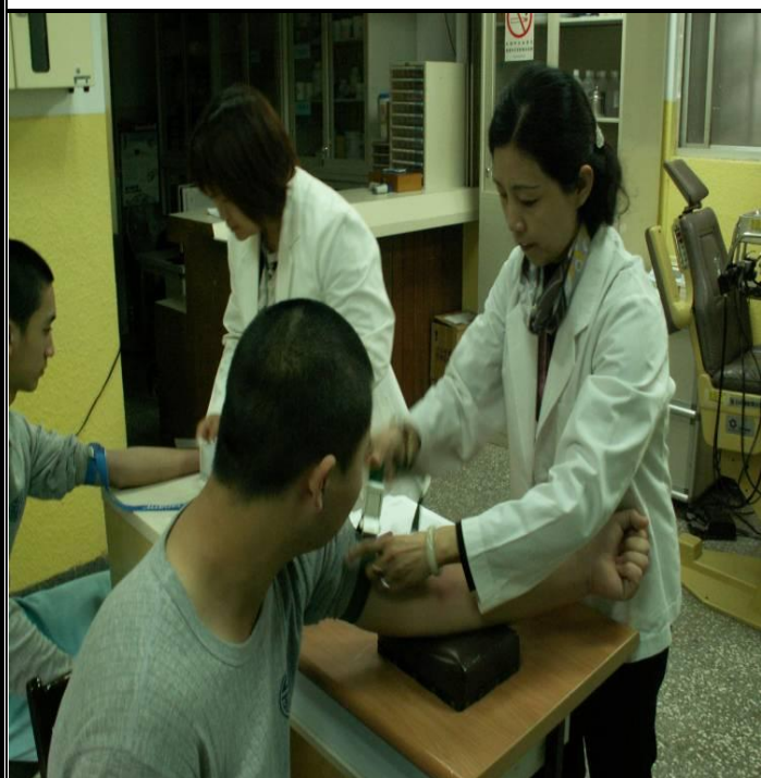
2月4日每月定期抽血檢驗