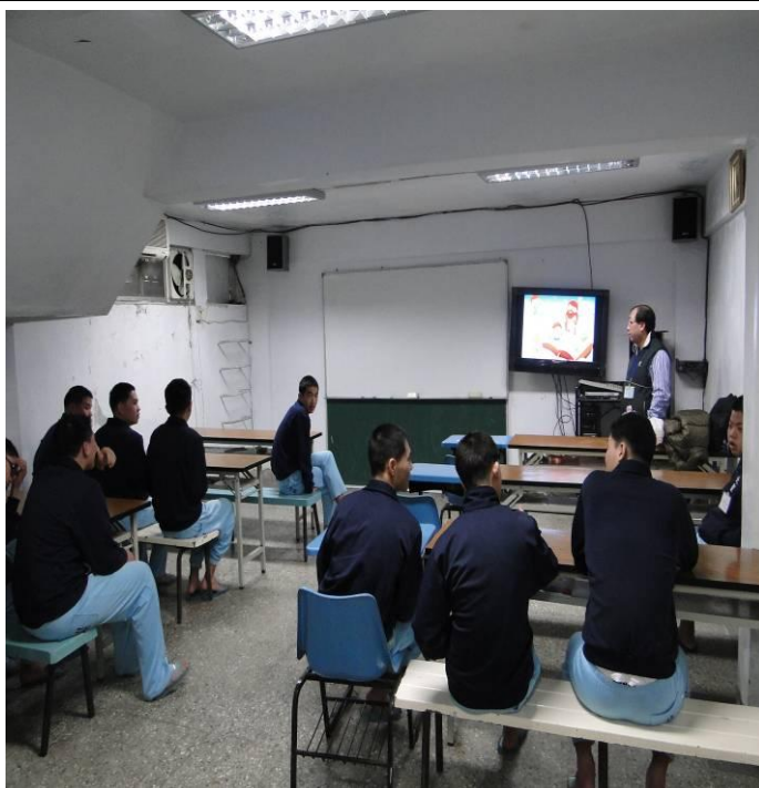
2月份基督教婦女聖工會上課情形