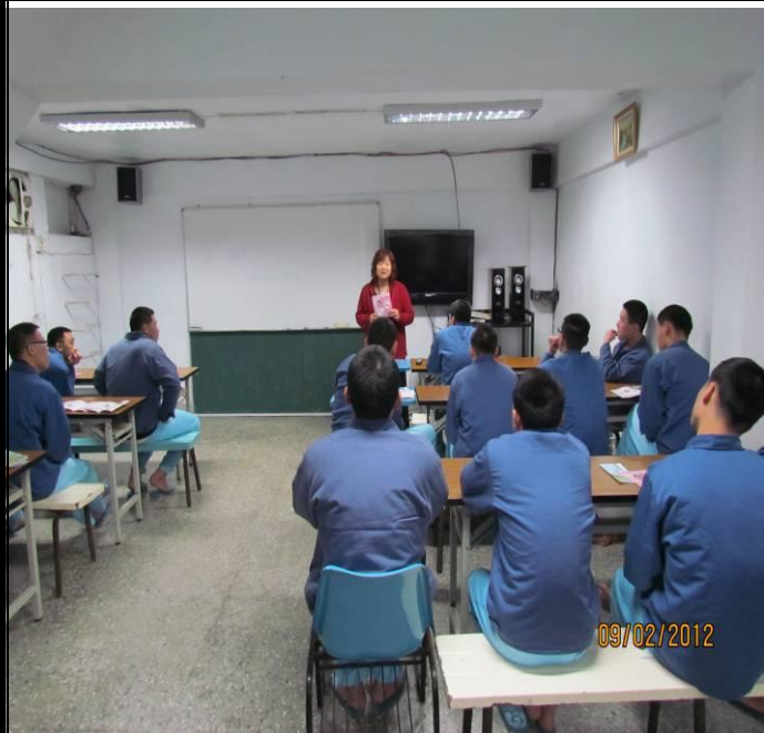
2月09日辦理菸害防治衛教