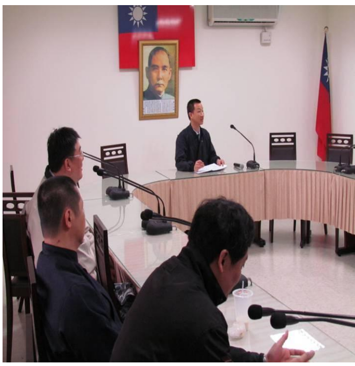
2月23日常年教育宣導情形