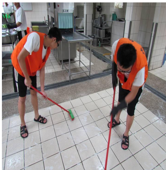
2月份炊場學生洗刷地板之情形