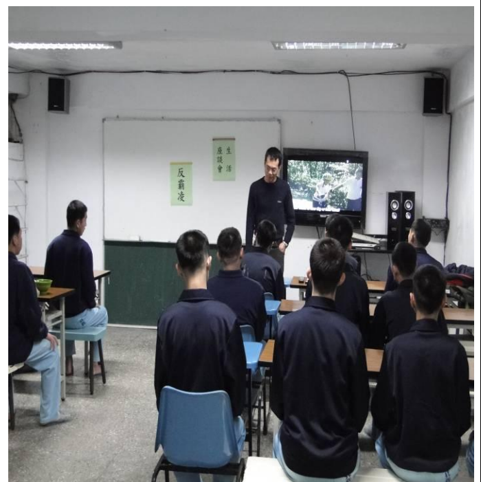
2月份新收講習情形