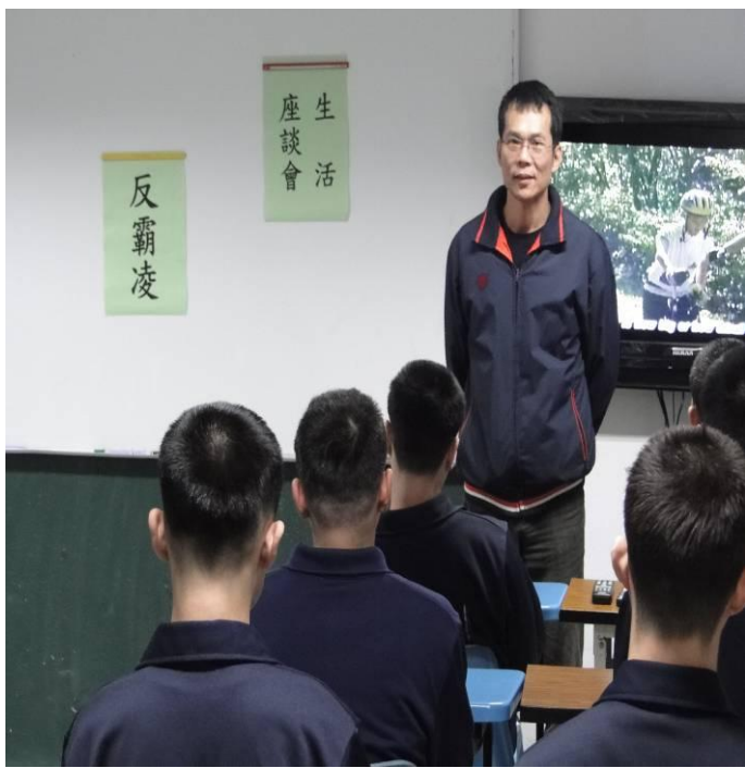
2月29日新收班生活座談會宣導