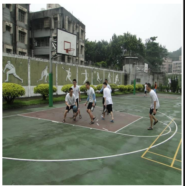
2月份體育活動情形