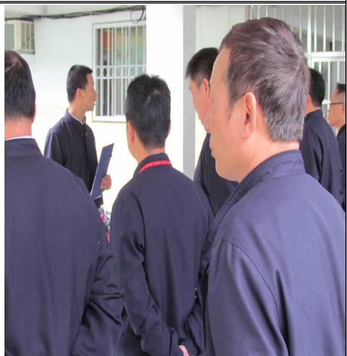
2月9日勤前教育宣導情形