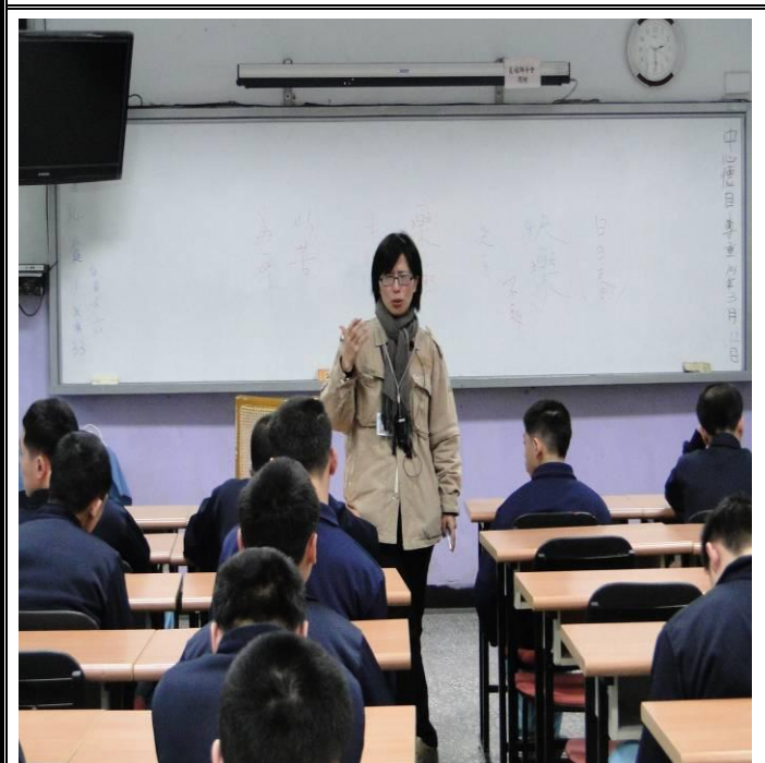
2月20日法律常識宣講