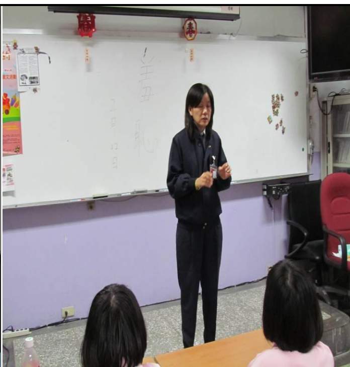
2月22日平班宣導情形