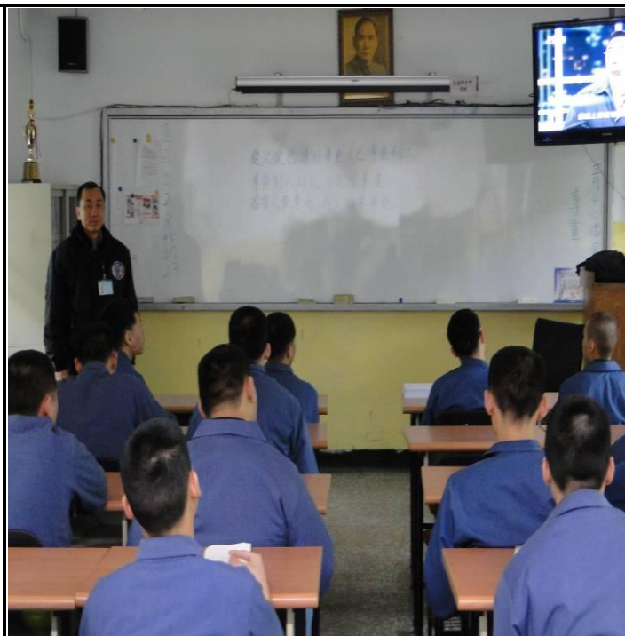
2 月份孝班上課情形