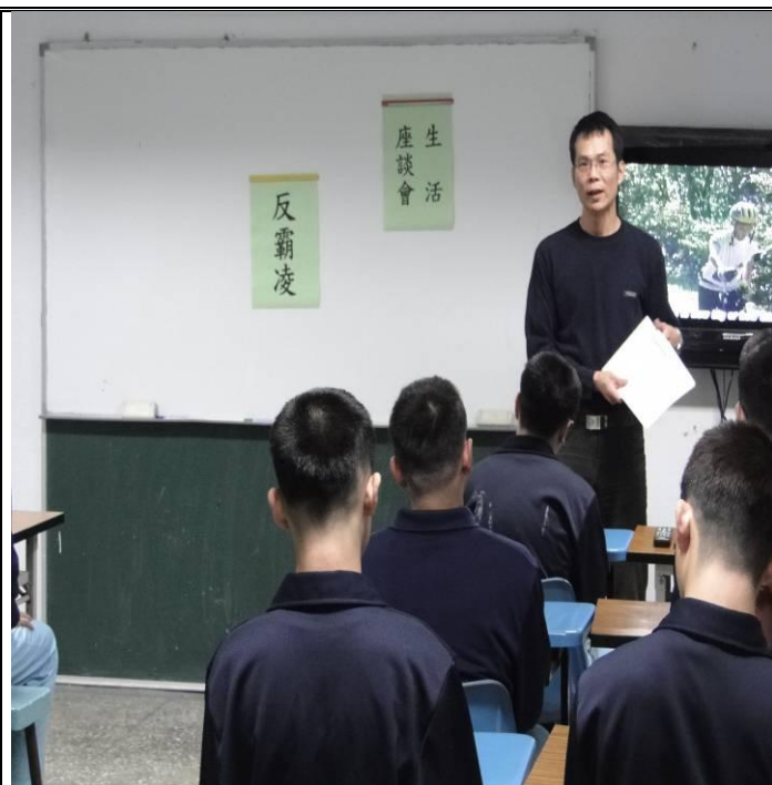
2月29日新收班宣導情形