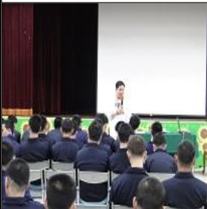
2月29日活動辦理情形