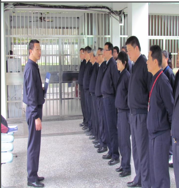
2 月 24 日勤前教育宣導情形