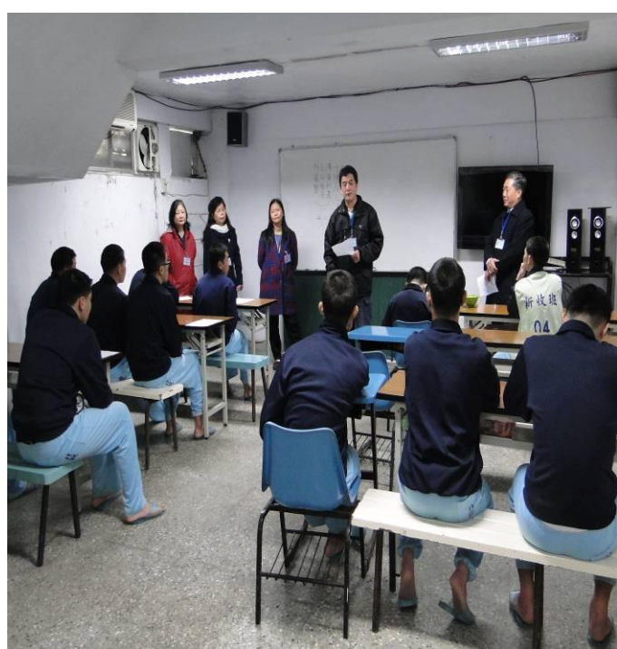
2 月份新收班上課情形