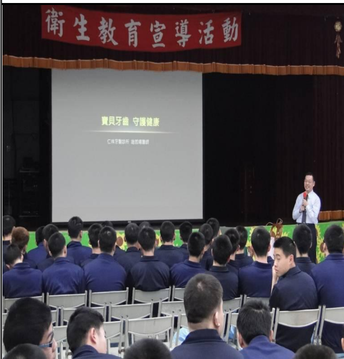
2月22日與仁祥牙醫診所合辦「口腔保健 衛生教育宣導」專題演講