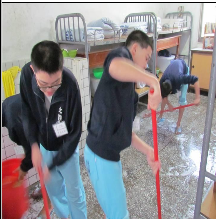
2月15日新收班環境大掃除情形