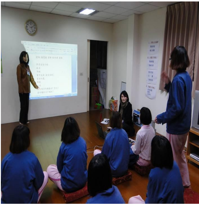
2月6日戒毒輔導團體之影片賞析