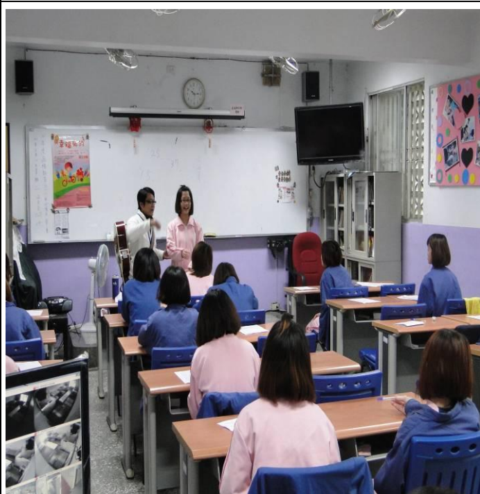
2月21日平班上課情形