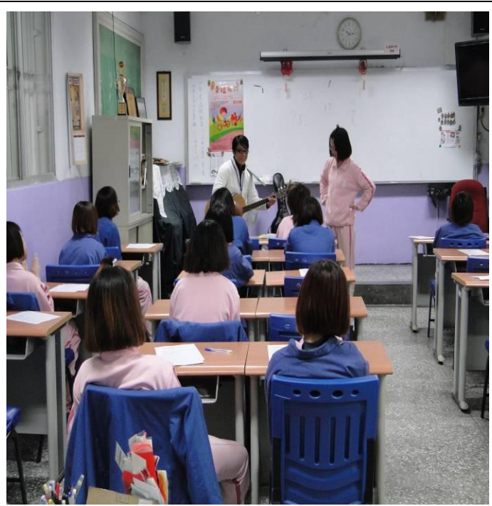
2月21日平班上課情形