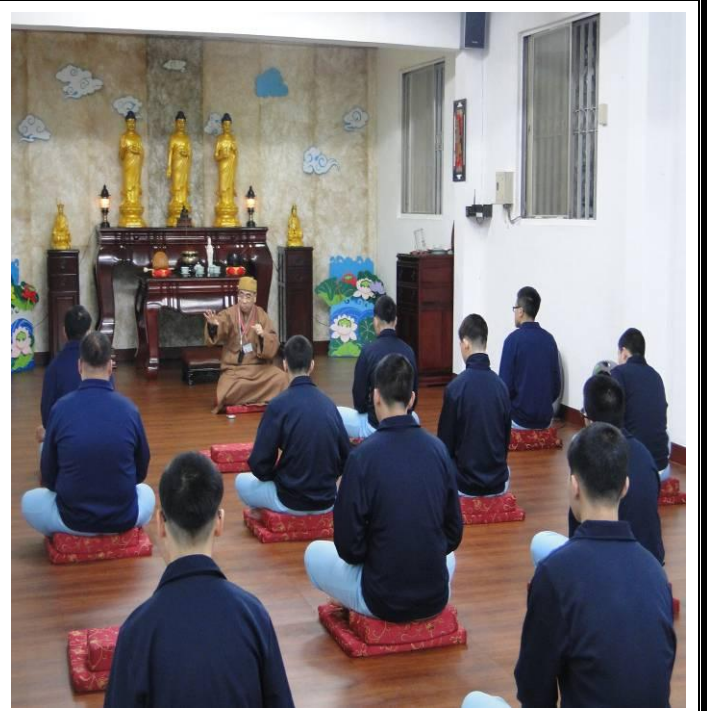
2月份佛教開心蓮線上課情形