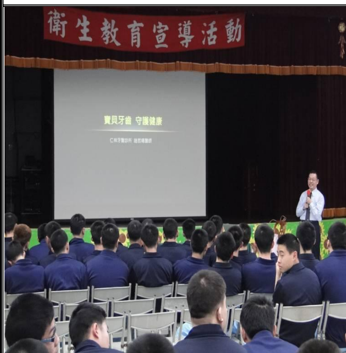
2月22日辦理口腔衛教活動