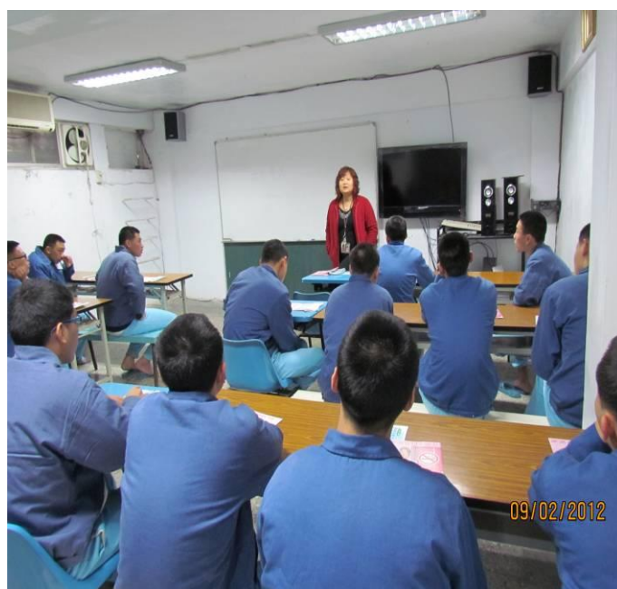
增進本所收容少年戒菸知能