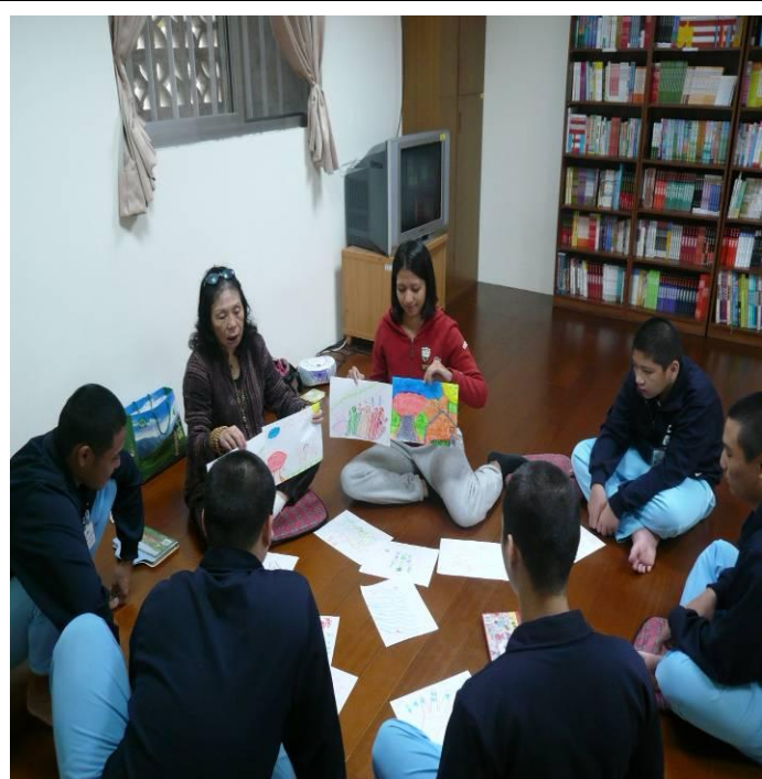
2月份親職教育上課情形