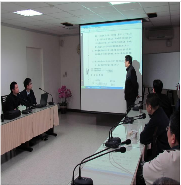
2月23日常年教育宣導情形