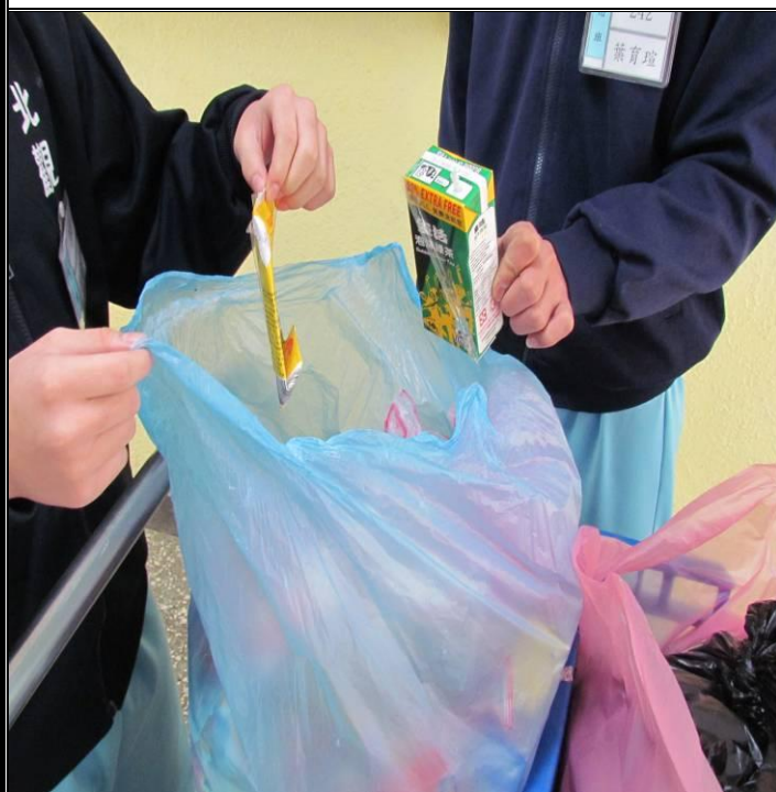
2月份忠班資源分類情形