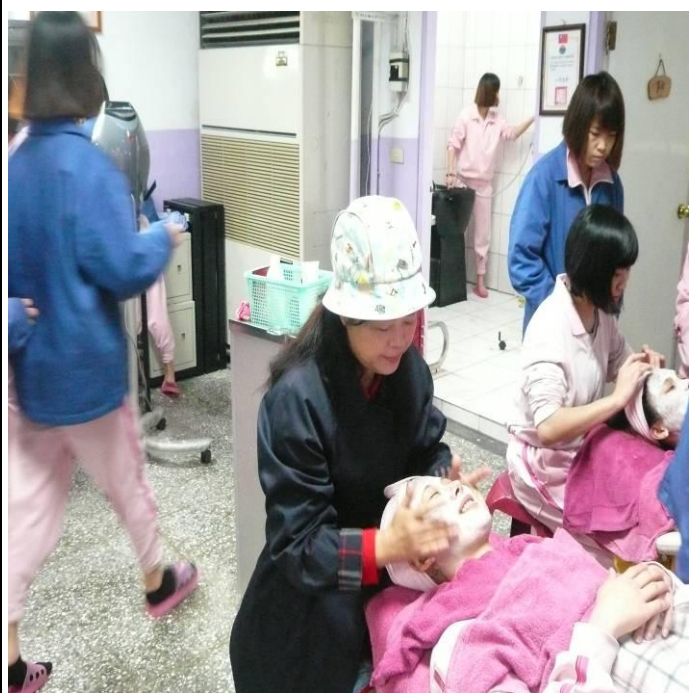
2 月份美容美髮班上課情形