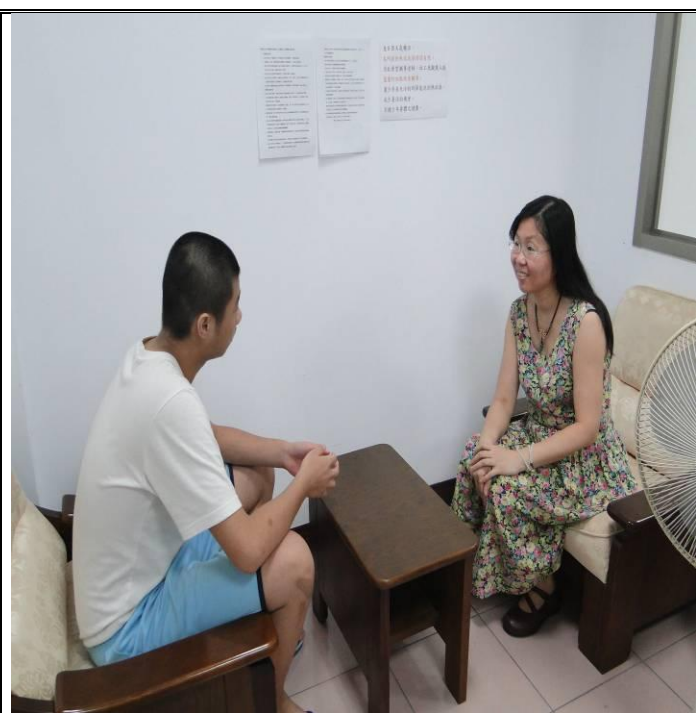
2月份個別輔導情形