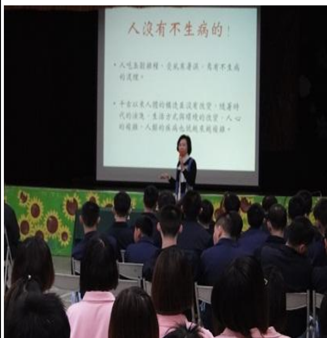
3 月 7 日臺北市婦女會「高牆裡的心希望-心靈講座」專題演講