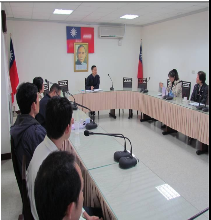
4月11日常年教育宣導情形