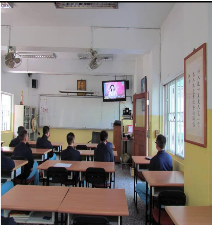
3 月 6 日孝班菸害衛教課程