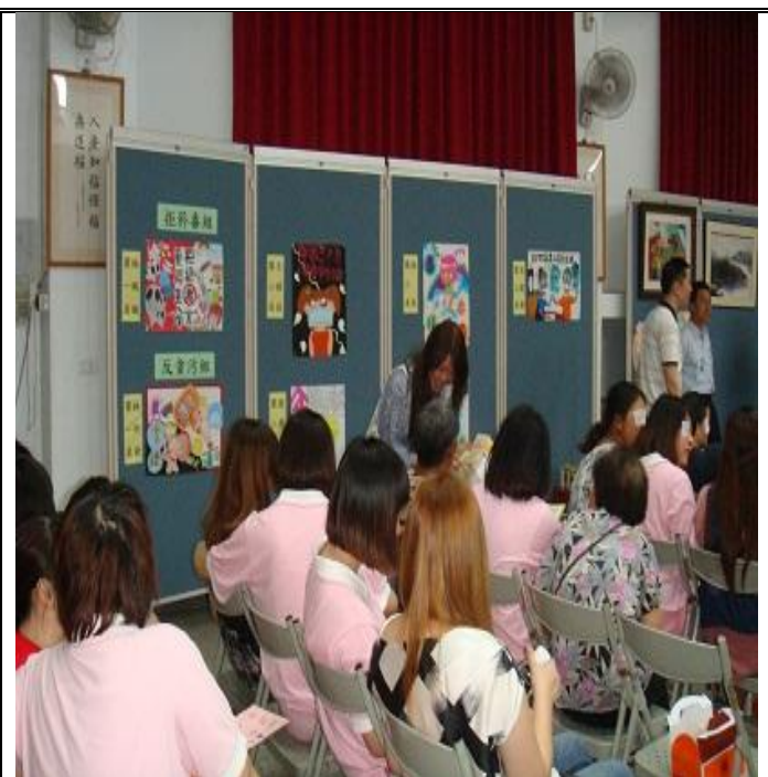
張貼於懇親會場情形