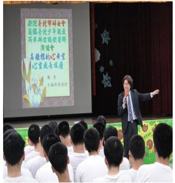
4月12日臺北市婦女會「高牆裡的心希望 - 心靈講座」專題演講