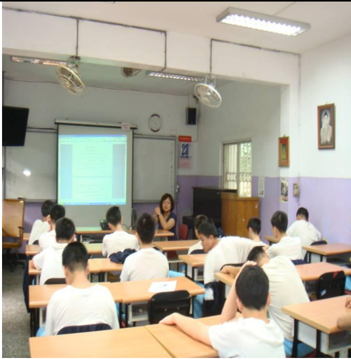
4月23日忠班傳染病防治衛教宣導