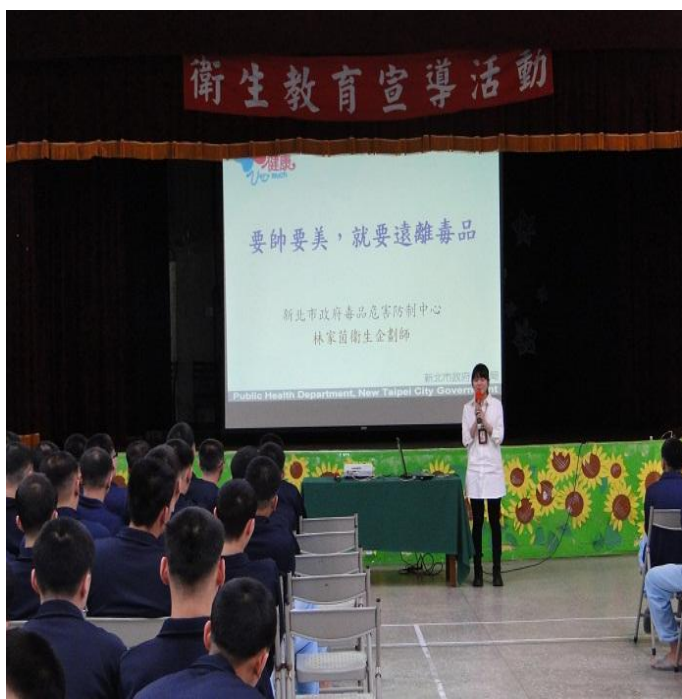
3月28日新北市衛生局「毒品防治衛教宣導」專題演講