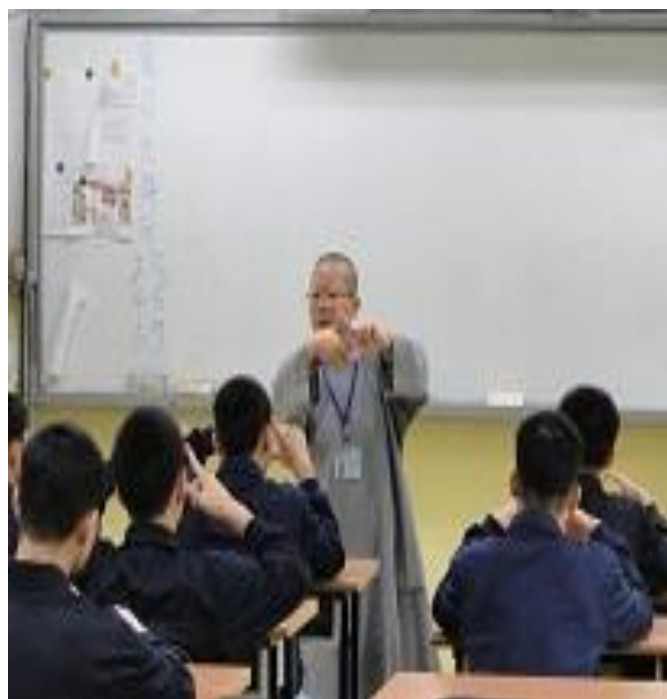
4 月份佛青會上課情形