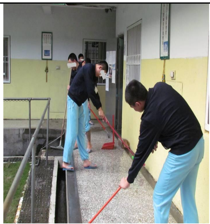
4 月 13 日孝班環境大掃除情形