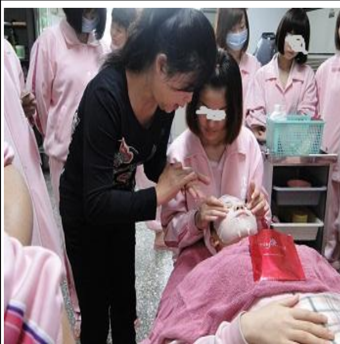
4 月份美容美髮班上課情形