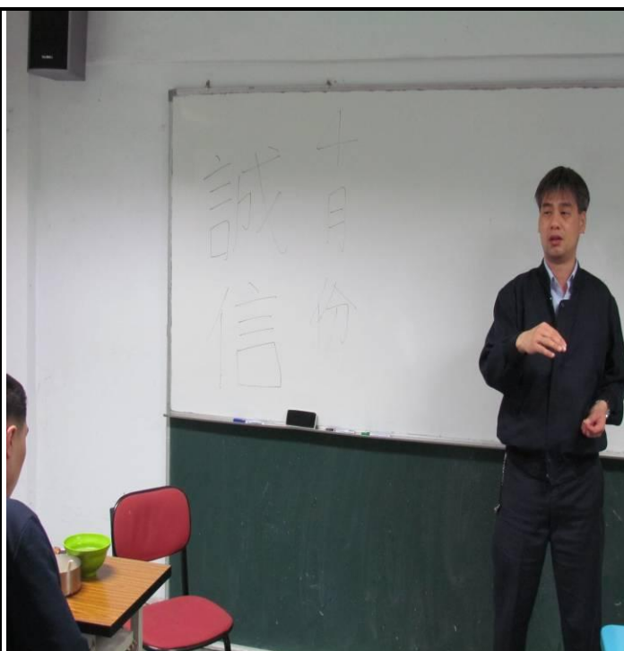
4月10日新收班宣導情形