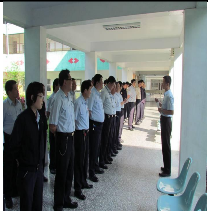
3月12日勤前教育宣導情形