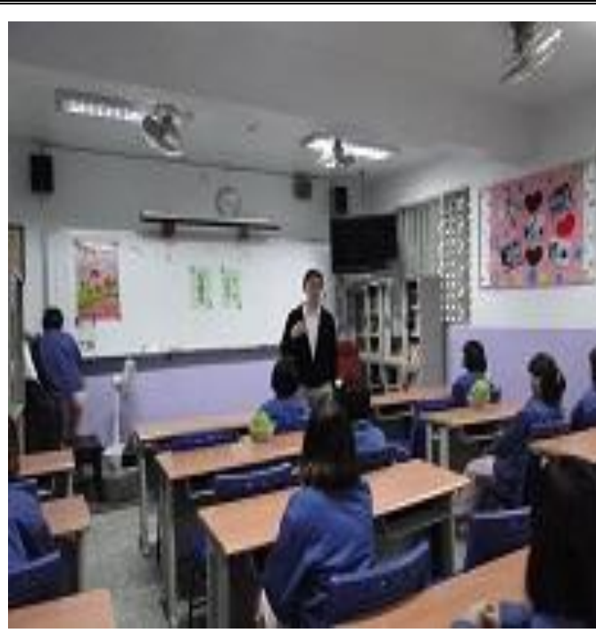
4 月份平班生活座談會宣導