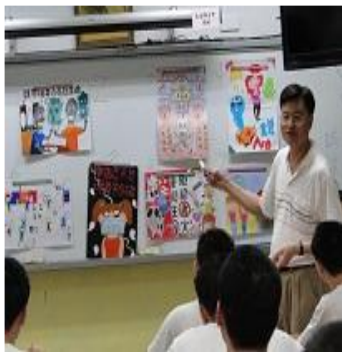
4 月份拒菸、反貪海報比賽