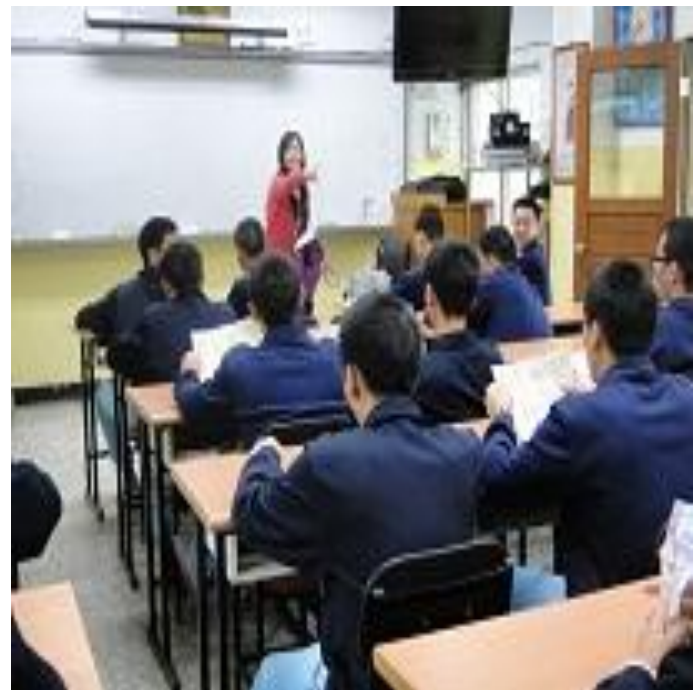
4 月 27 日板橋法扶之消保法法宣導