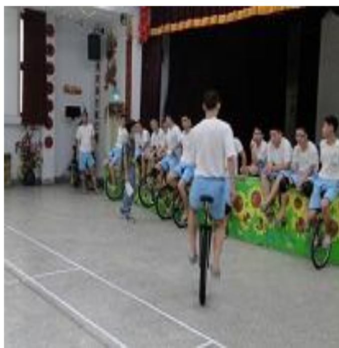
4 月份一輪車班上課情形