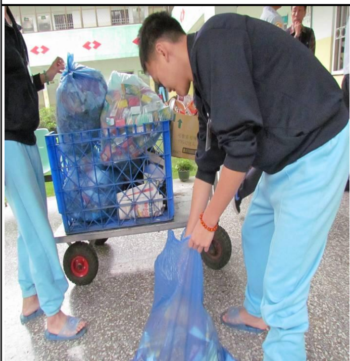
3 月份新收班收容少年資源分類情形