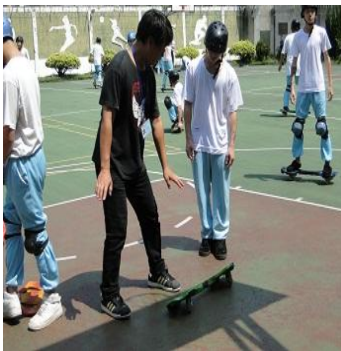
3 月份蛇板班上課情形