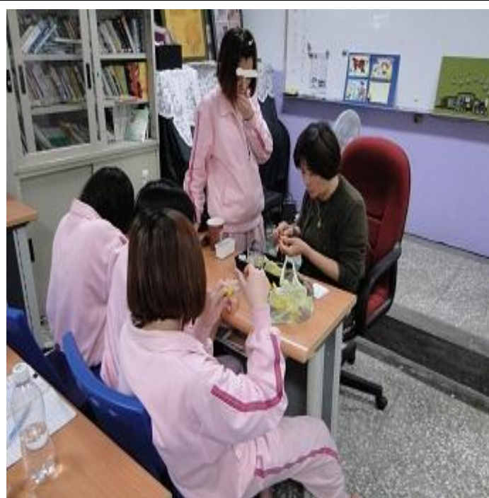
3 月份編織班上課情形