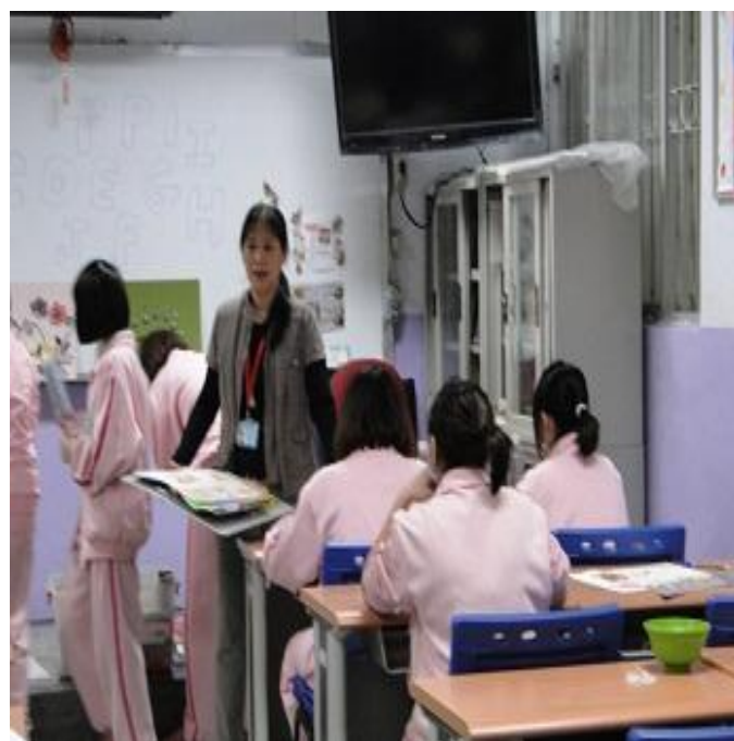
4 月份美術課上課情形