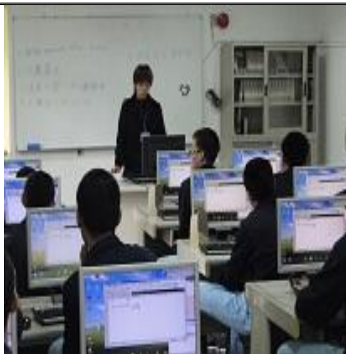
4 月份孝班電腦班上課情形