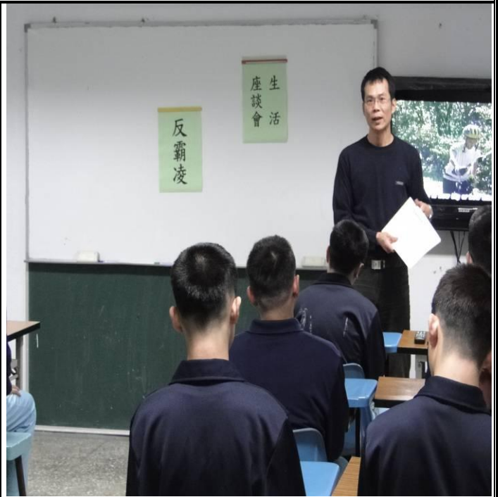
3 月份新收班宣導情形