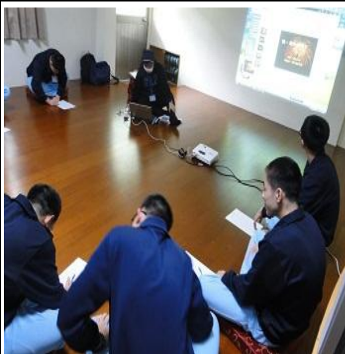
3 月份性侵家暴之輔導團體