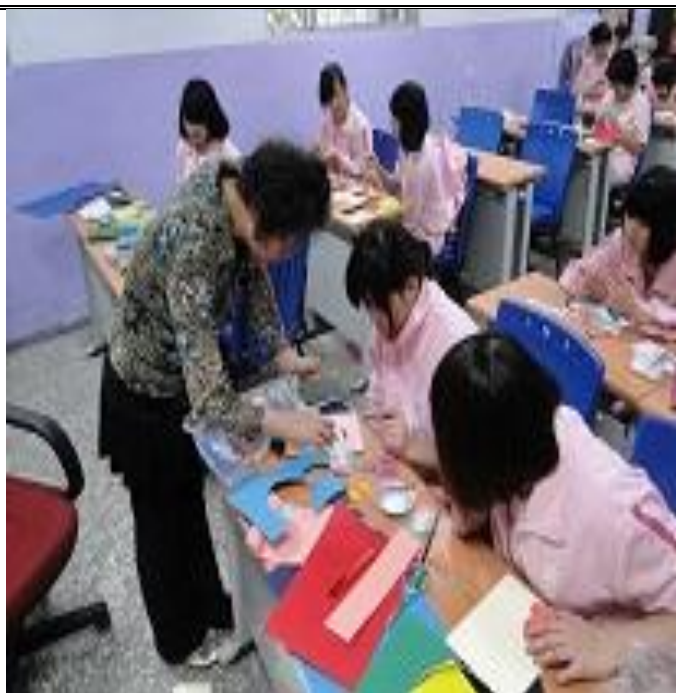
3 月份紙花班上課情形