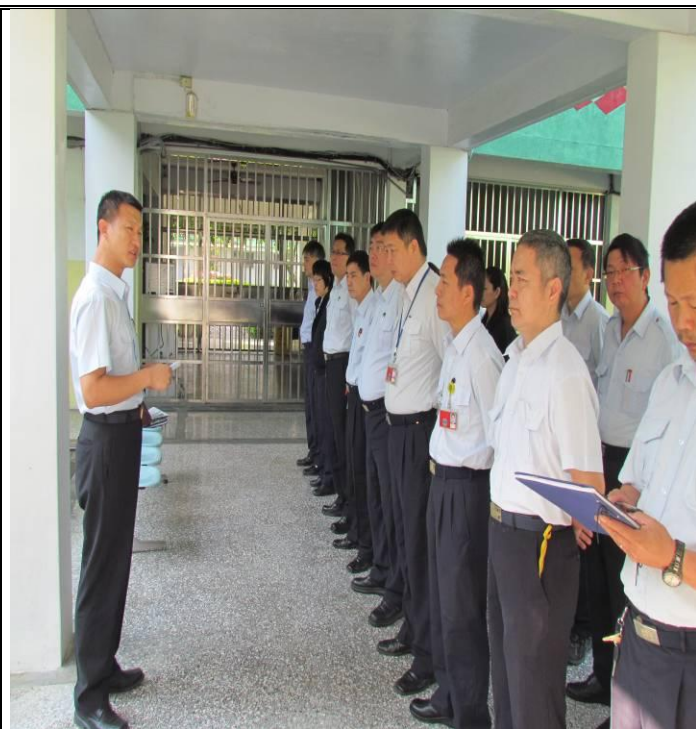
4 月 10 日勤前教育宣導情形