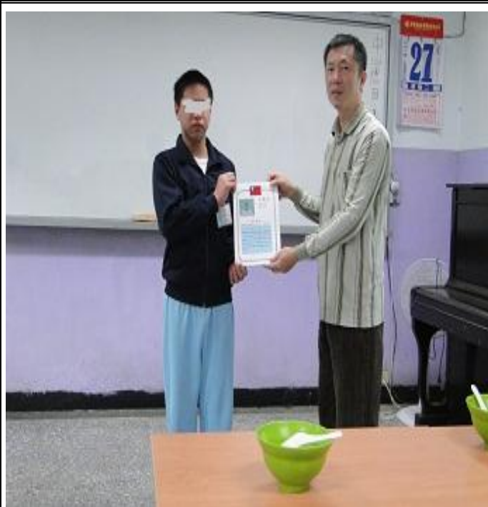
3 月份忠班生活座談會宣導