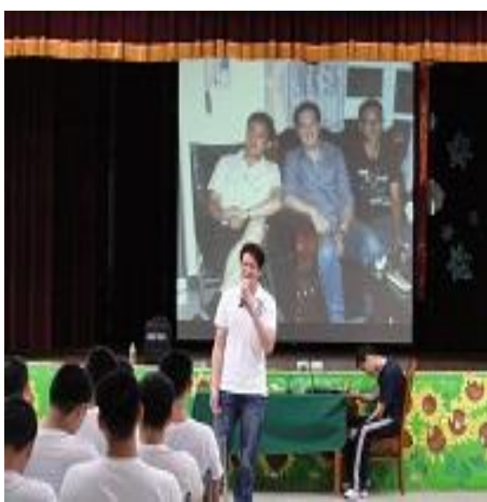
4月12日中原大學「戒成專案」活動