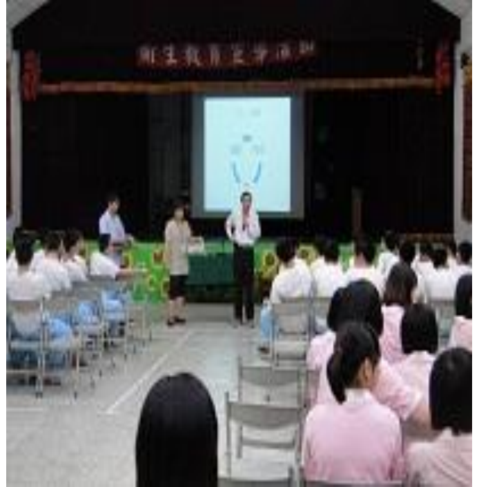
4月20日臺北市家具公會蒞所「傳 i 送關懷聯歡會」活動