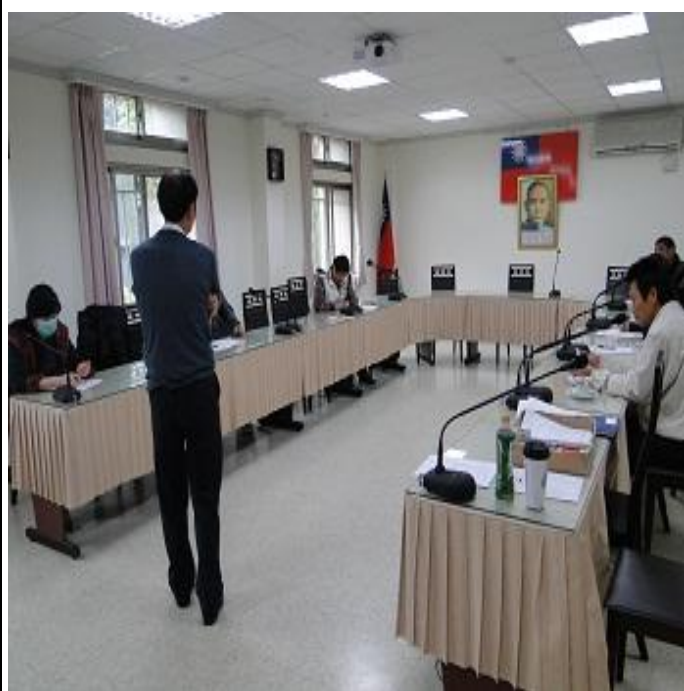
3 月份親職教育情形