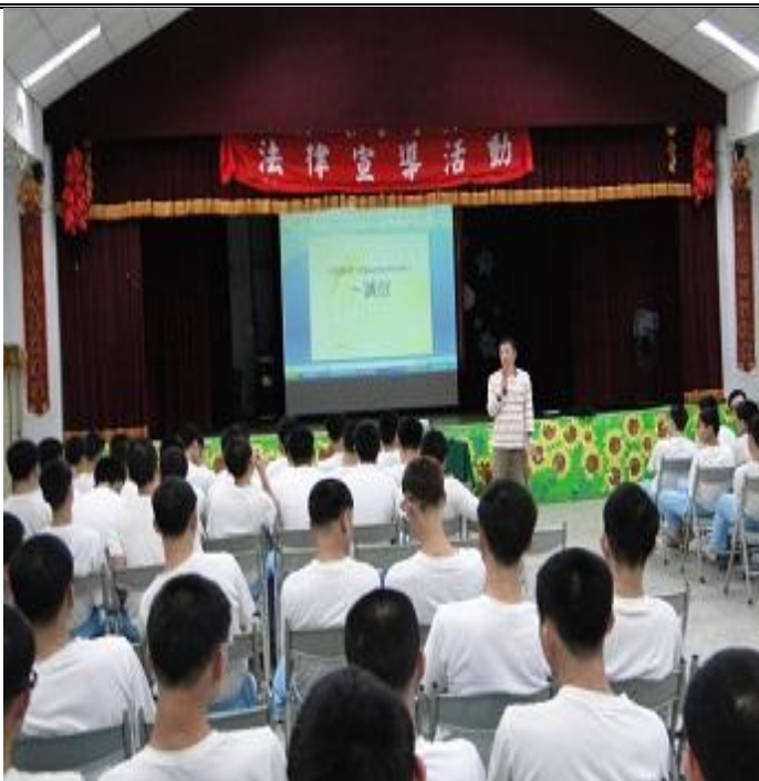
4月11日生命教育上課情形