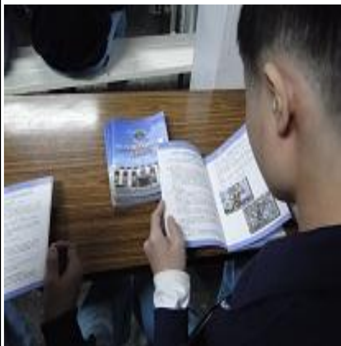
3 月份發放生活手冊情形