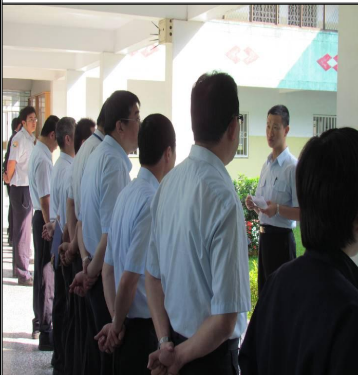
3 月 22 日勤前教育宣導情形