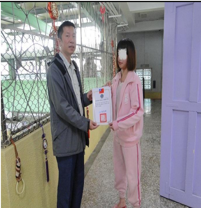
3 月份徵文比賽頒獎情形