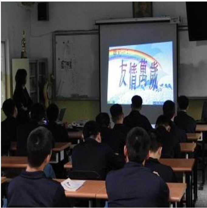
3 月份孝班上課情形