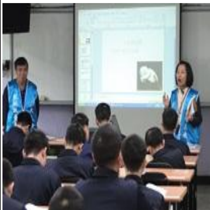
3 月份天主教監獄服務社上課情形