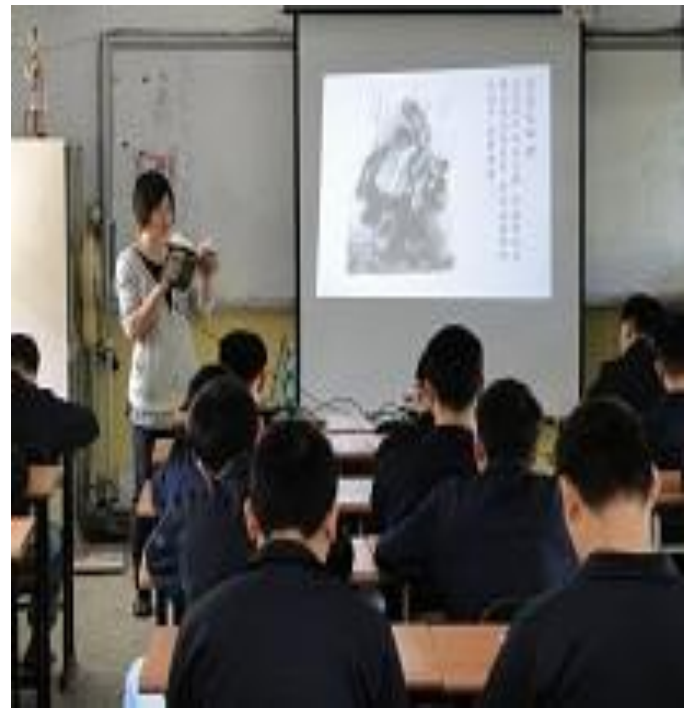
4 月份忠班上課情形