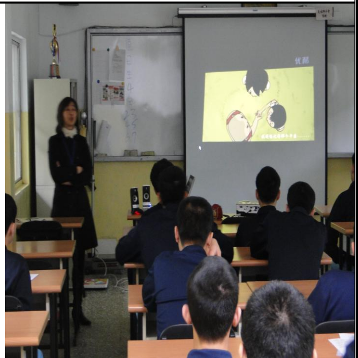
4 月 11 日「心六倫運動」影片觀賞情形