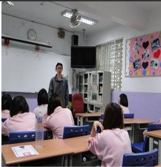
4 月份平班宣導情形