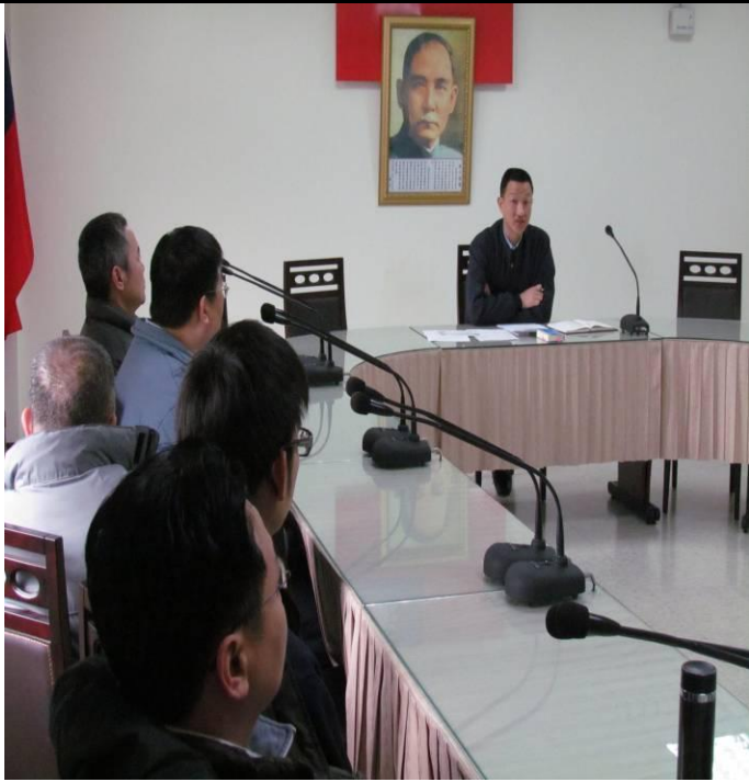
3月13日常年教育宣導情形