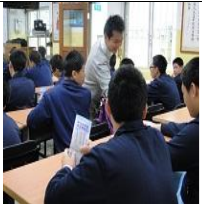
4 月份人權教育上課情形