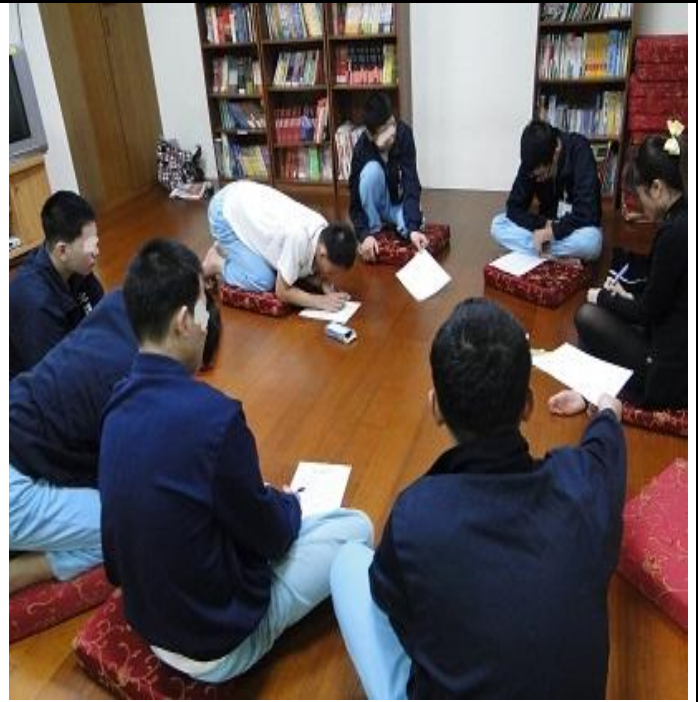
3月份毒品案件之類別輔導情形