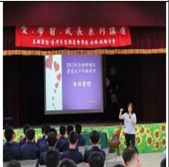
4月18日「兩性關係」專題演講