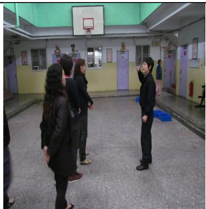
4月27日收容少年家屬參訪情形