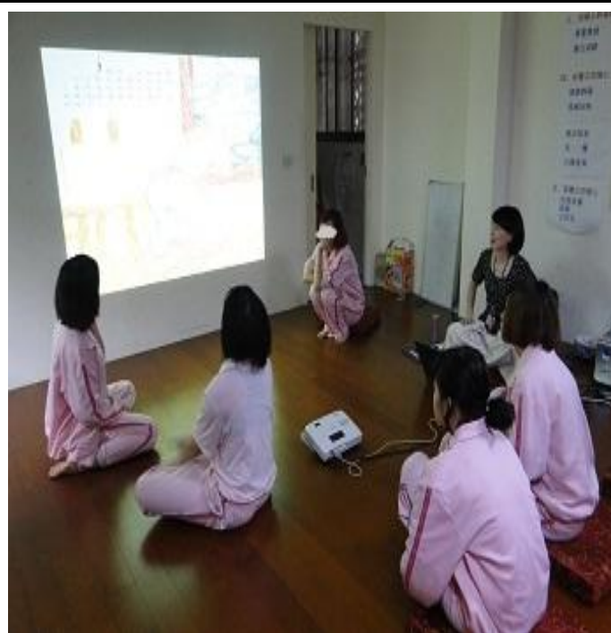
4 月份戒毒輔導團體