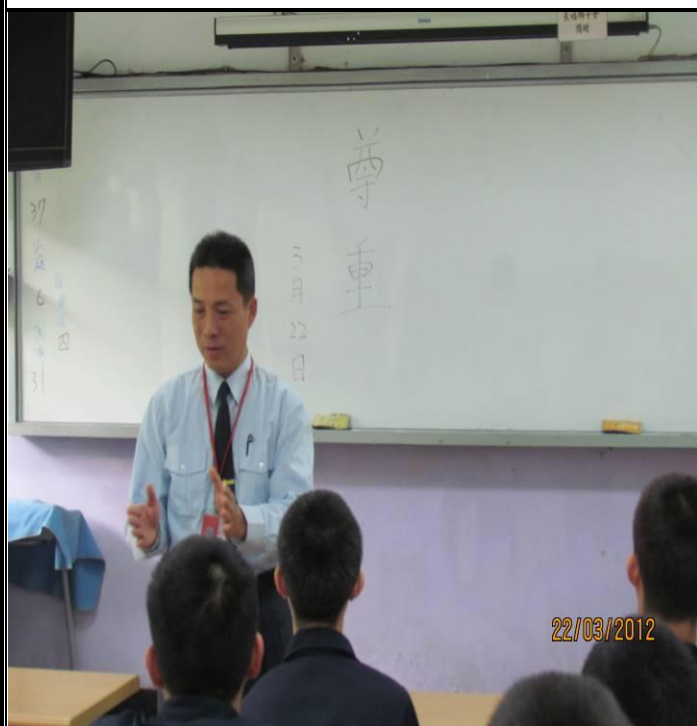
3月22日忠班宣導情形