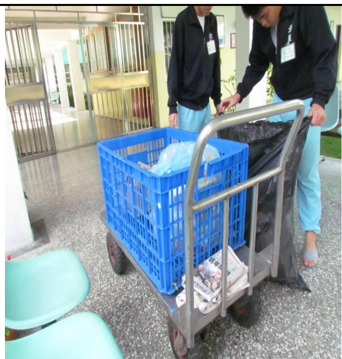
4 月份孝班收容少年資源分類情形