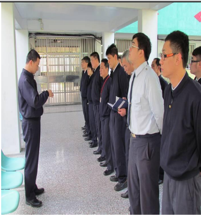
3月2日勤前教育宣導情形