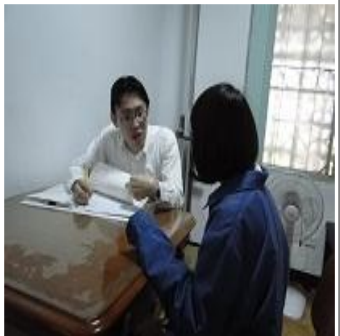
3月份個別輔導情形