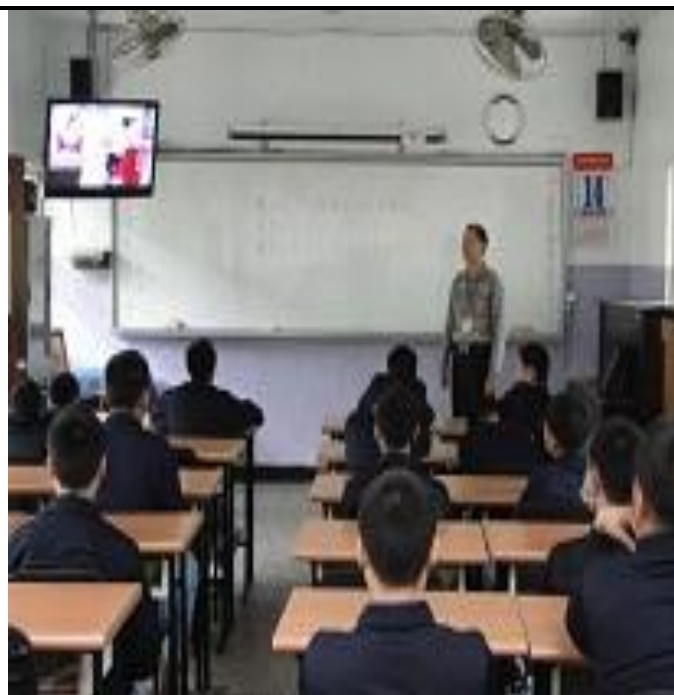
3 月份忠班上課情形