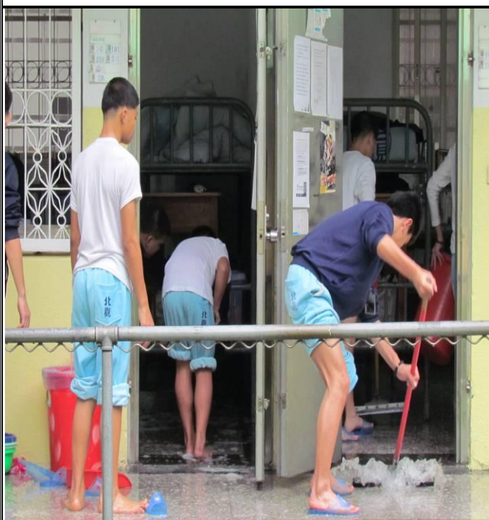
3 月 16 日忠班環境大掃除情形