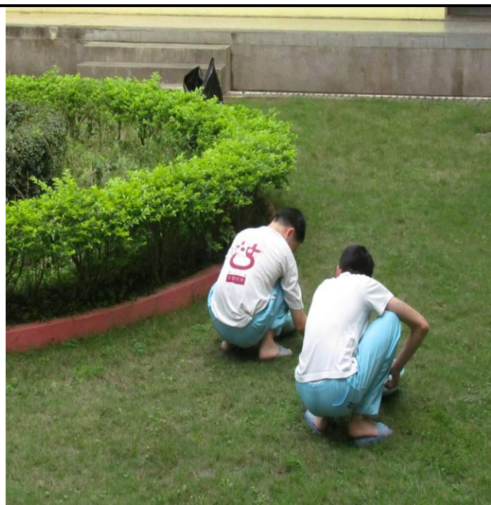
4月10日忠班收容少年整理庭園之情形