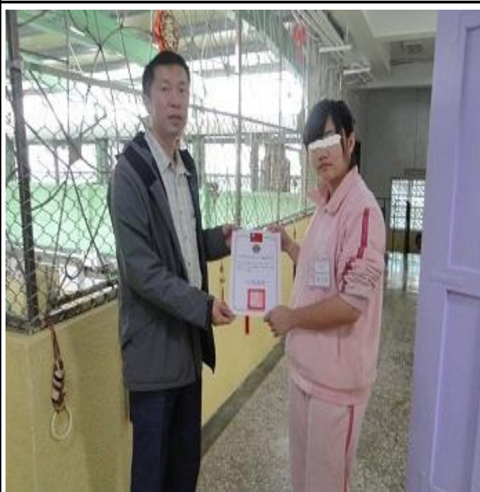
3 月份心六倫徵文比賽頒獎