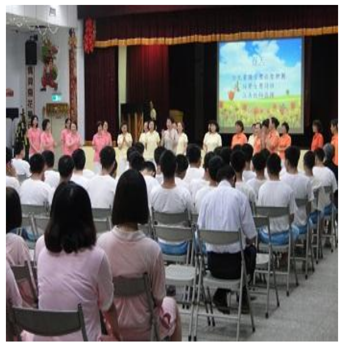
6月13日更生團契「詠聲詩班音樂饗宴」 音樂會