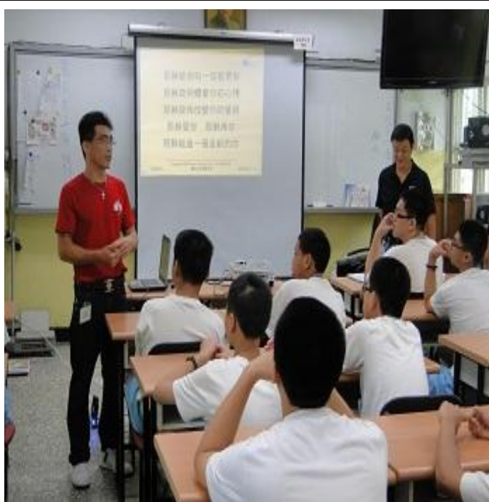
6 月份天主教監獄服務社上課情形