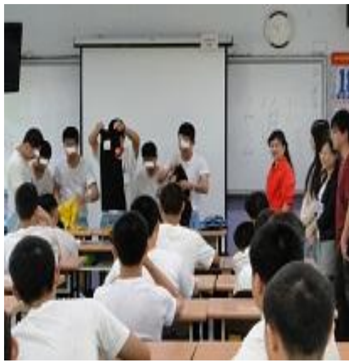
5月份兩性關係上課情形