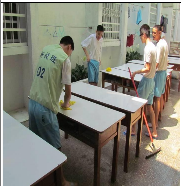
5 月 23 日新收班環境大掃除情形