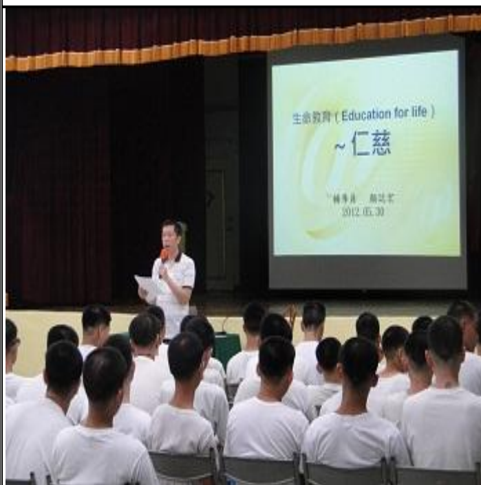
5月30日生命教育上課情形