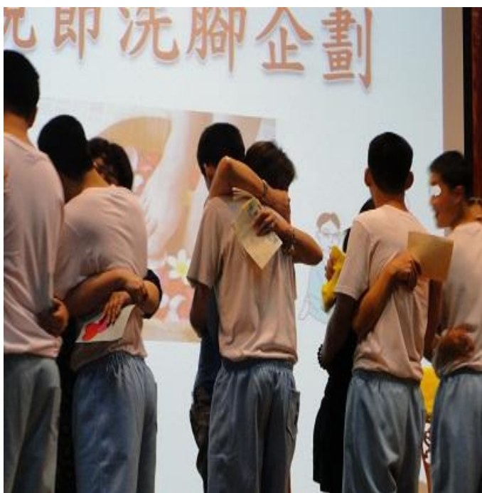
5月9日更保三分會「母親節面對面懇親」活動