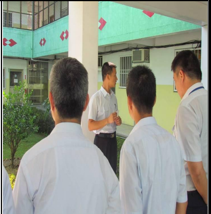
6月4日勤前教育宣導情形