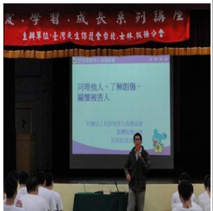
5月16日犯保板橋分會「修復式司法暨被害人保護服務措施」專題演講