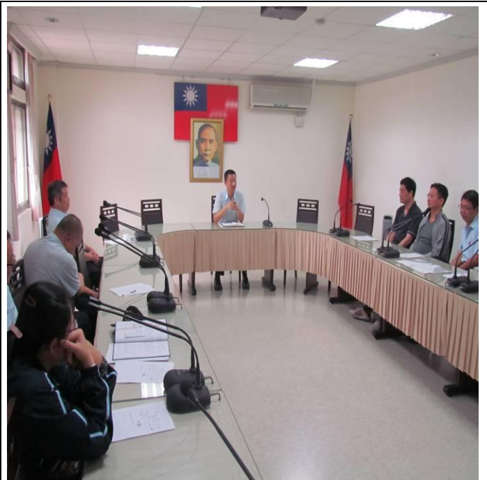
6月15日常年教育宣導情形