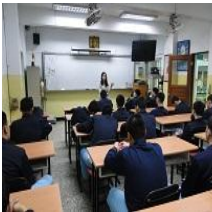
5 月 11 日板橋法扶之修復式司法宣導