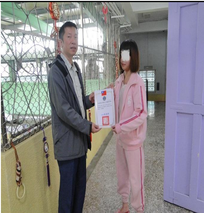
3 月份徵文比賽頒獎情形