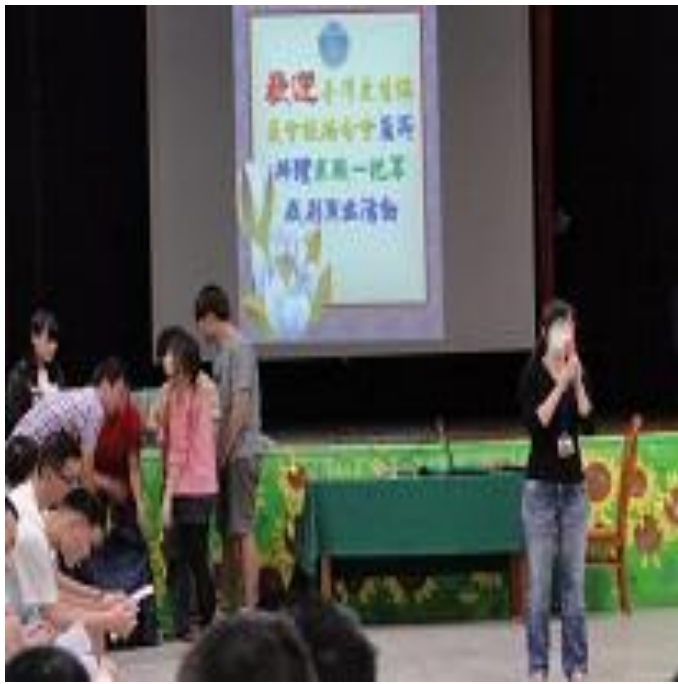
5月2日更保板橋分會「求職一把罩」表演活動