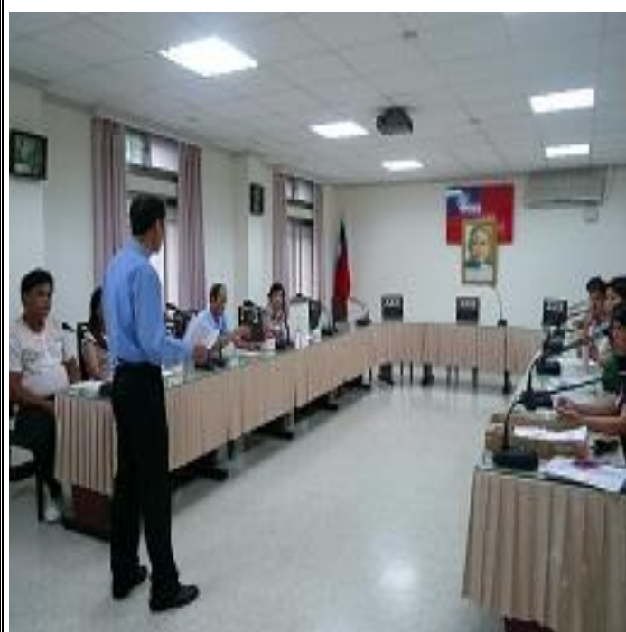
6月份親職教育情形