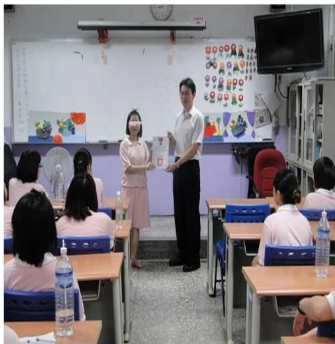
5 月份 LOGO 設計比賽頒獎