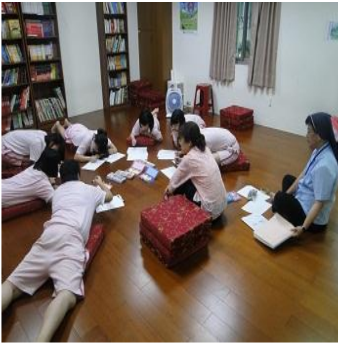
6 月份情緒管理之輔導團體