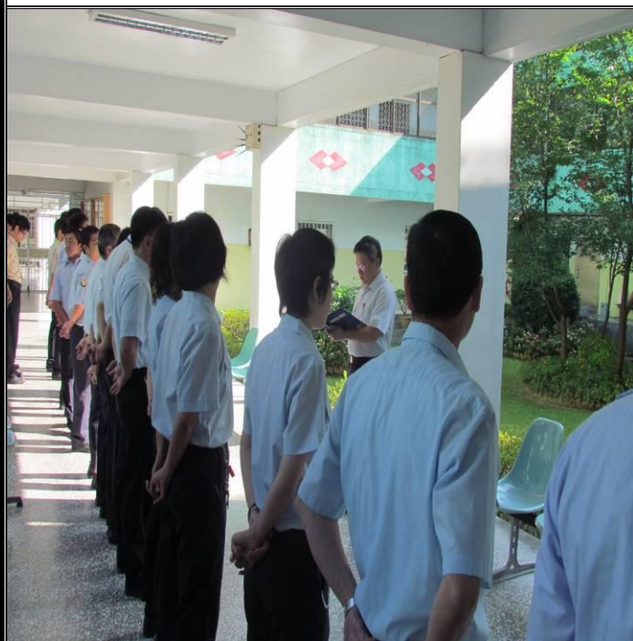
5 月 15 日勤前教育宣導情形