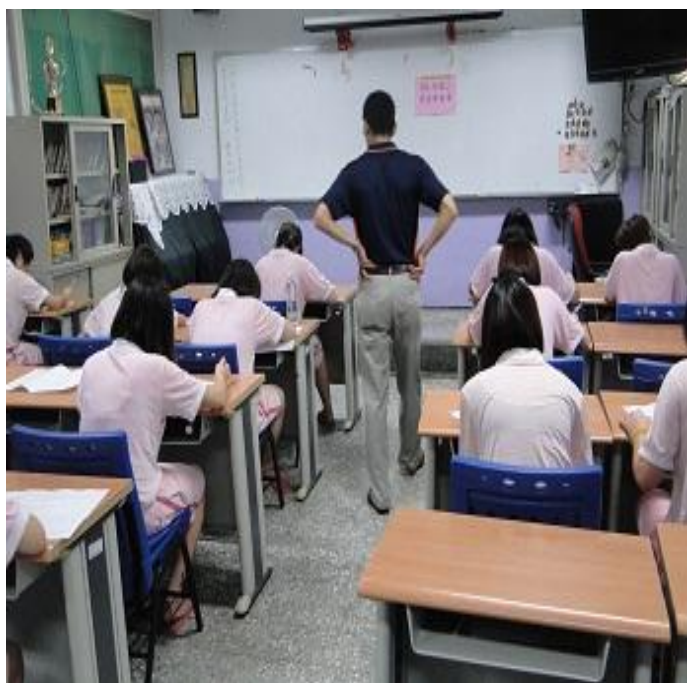
6 月份平班生活座談會宣導