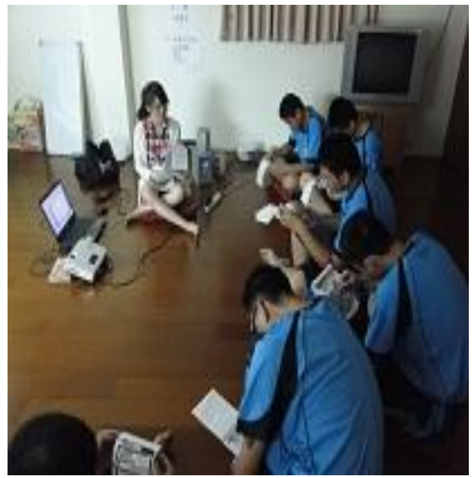
5 月份戒毒銜接輔導情形