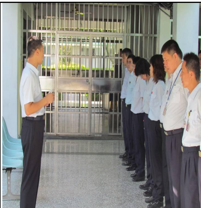
6月18日勤前教育宣導情形