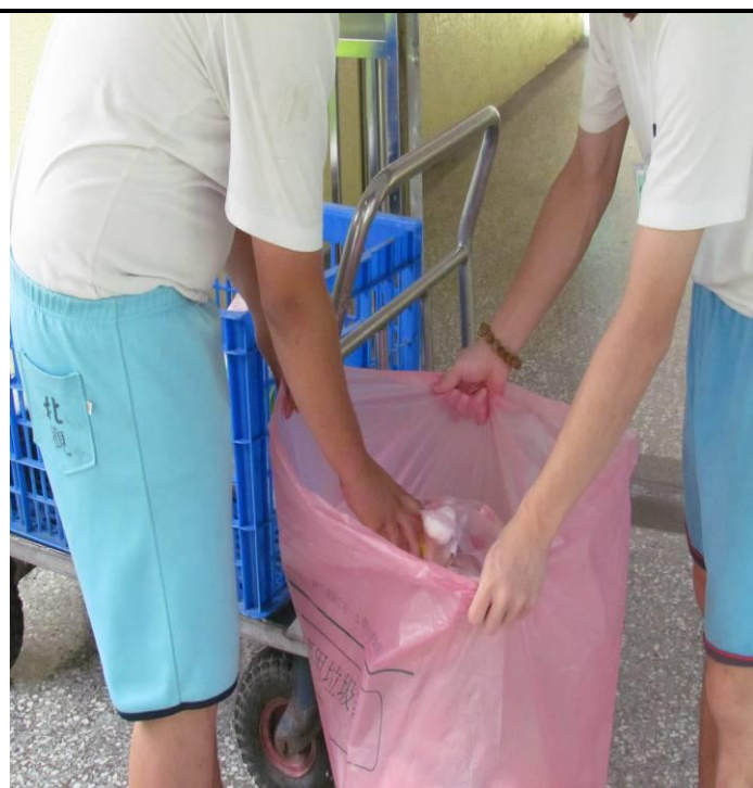
6 月份忠班收容少年資源分類情形