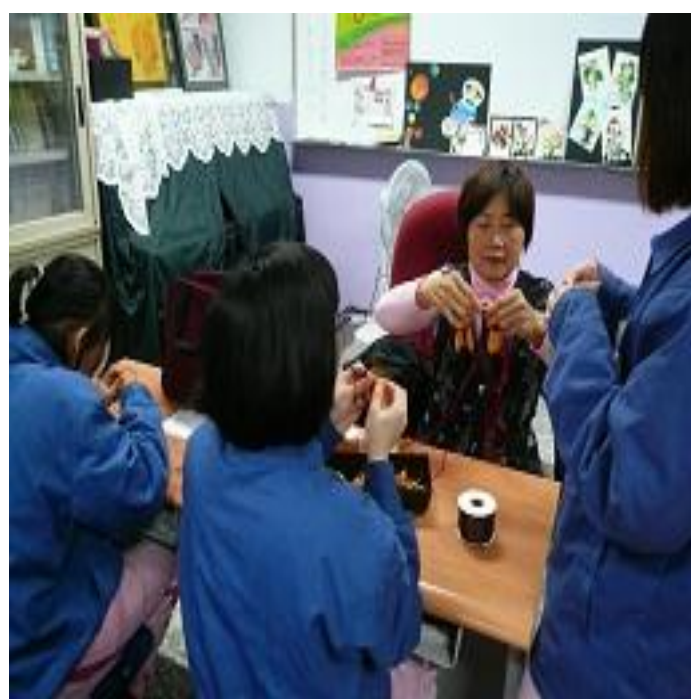
5 月份編織班上課情形