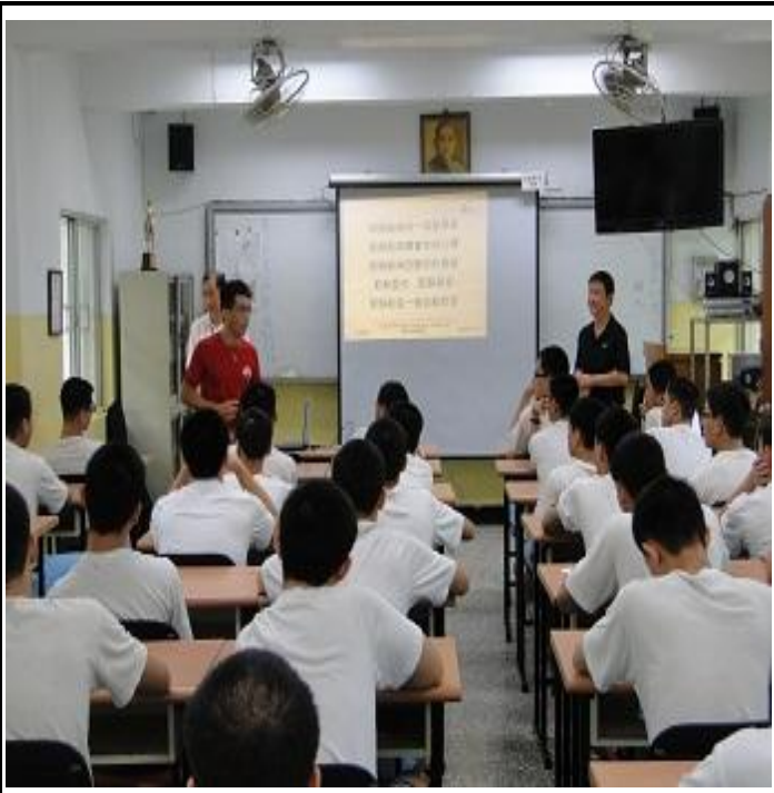
5 月份忠班上課情形