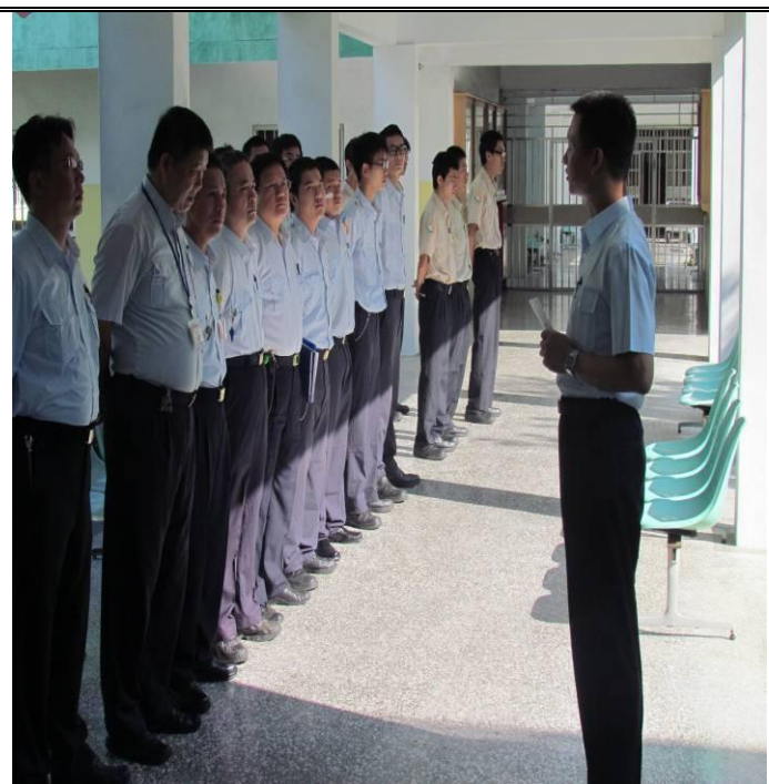
6 月 18 日勤前教育宣導情形