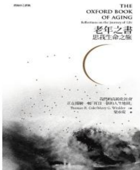
5月：老年之書：思我生命之旅