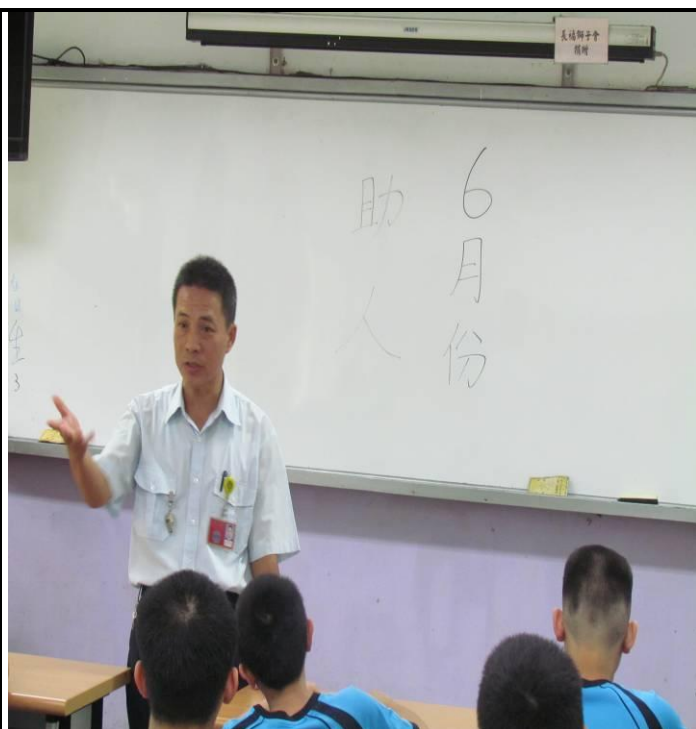
6月11日忠班宣導情形