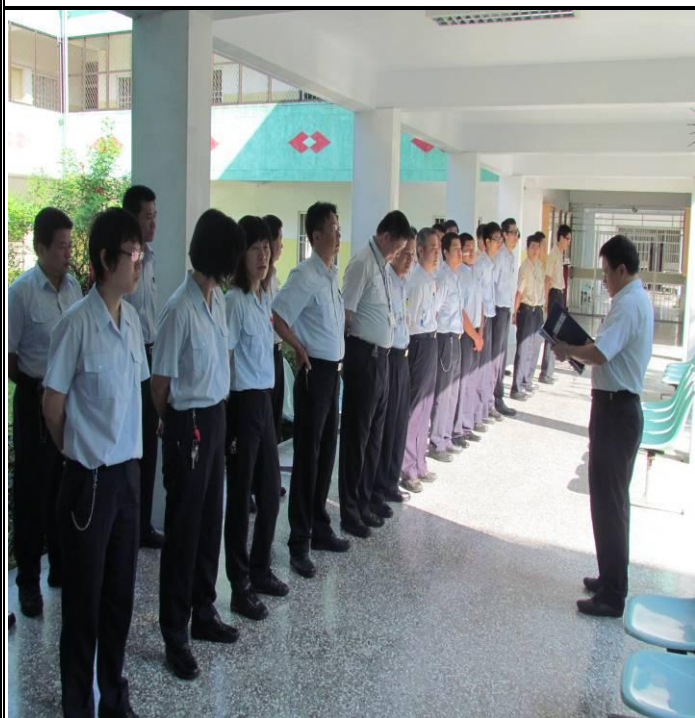
5月21日勤前教育宣導情形