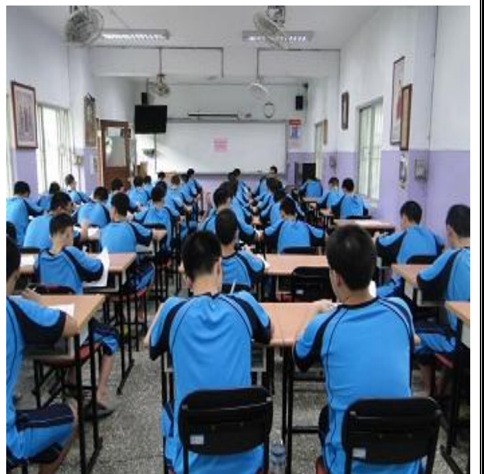
6 月 20 日舉行法律常識會考