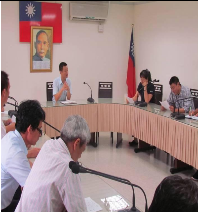
5月11日常年教育宣導情形