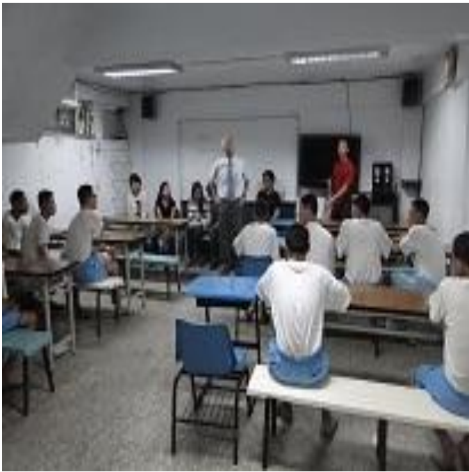
5 月份新收班上課情形