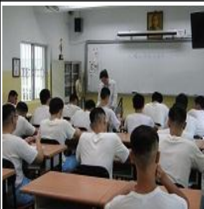
6 月份孝班上課情形