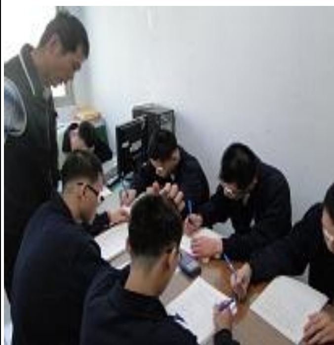
5 月份發放生活手冊情形