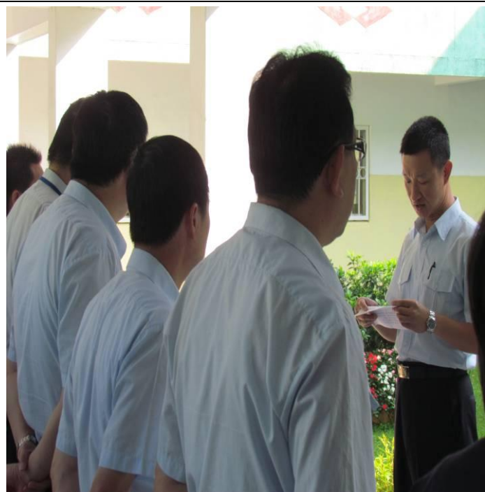
5月7日勤前教育宣導情形