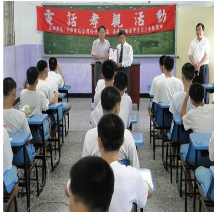
5月8日與中華電信合辦「母親節電話孝親」活動