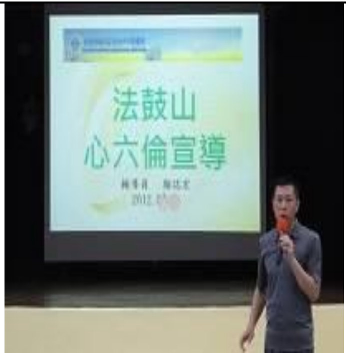
5 月 30 日「心六倫運動」影片宣導情形