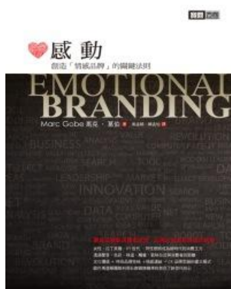
6月：感動創造『情感品牌』的關鍵法則