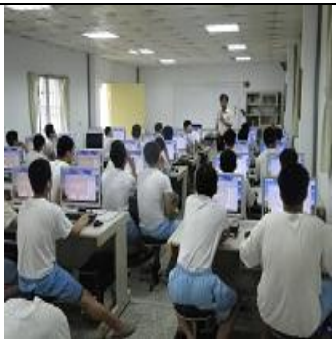
5 月份忠班電腦班上課情形