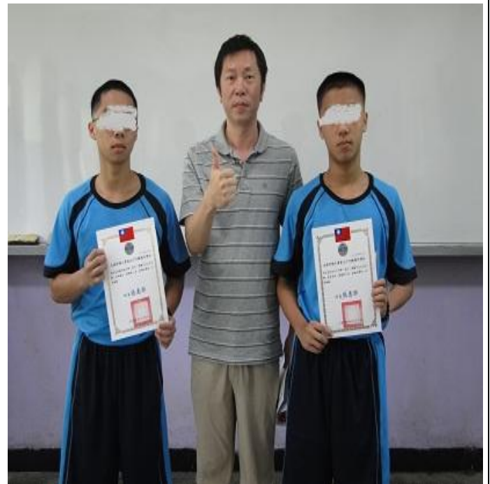
6 月份電腦中文輸入比賽