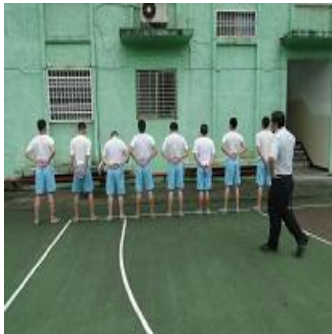
5 月份生活禮儀訓練情形