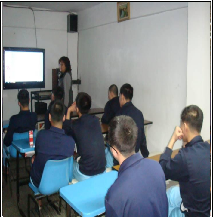
6 月 21 日平班菸害衛教課程