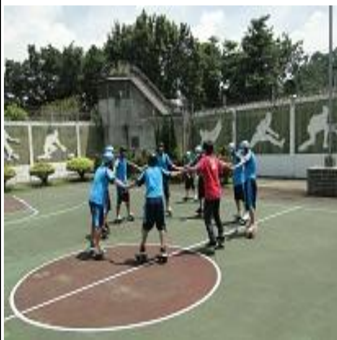
6 月份蛇板班上課情形