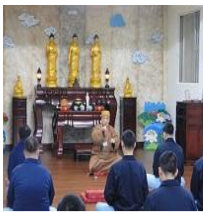
5 月份開心蓮線上課情形