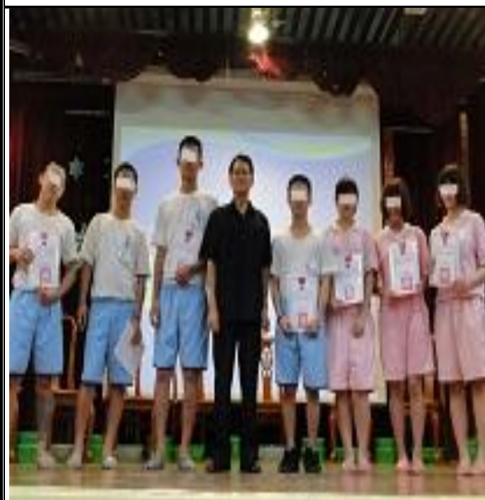
海報漫畫比賽頒獎情形