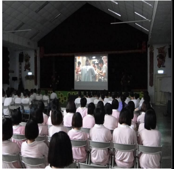
5月23日臺北市衛生局「愛滋病衛教宣導」 專題演講