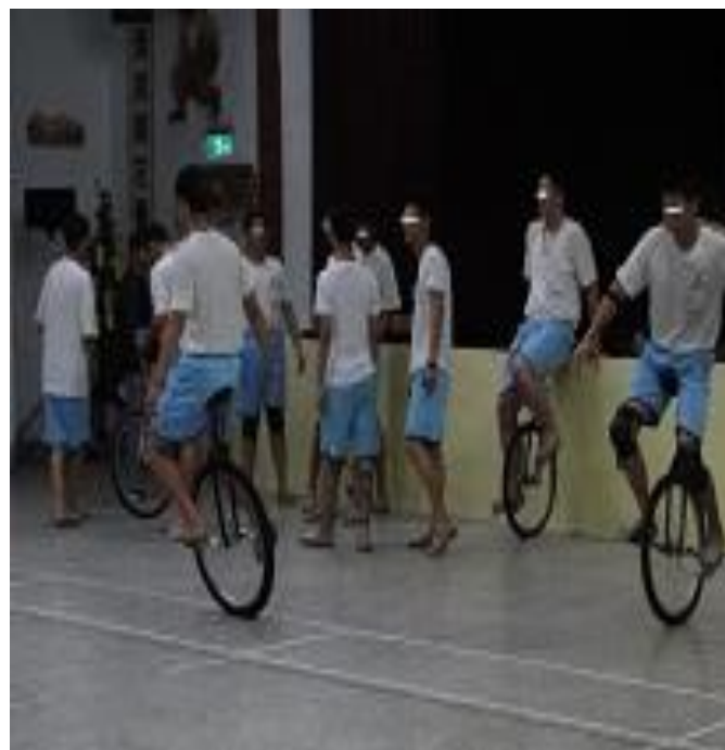
5 月份一輪車班上課情形