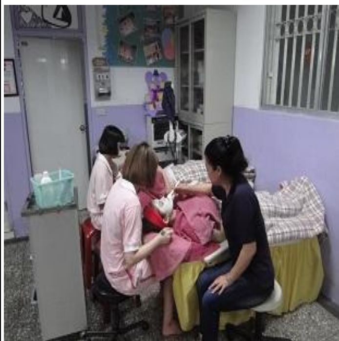
6 月份美容美髮班上課情形