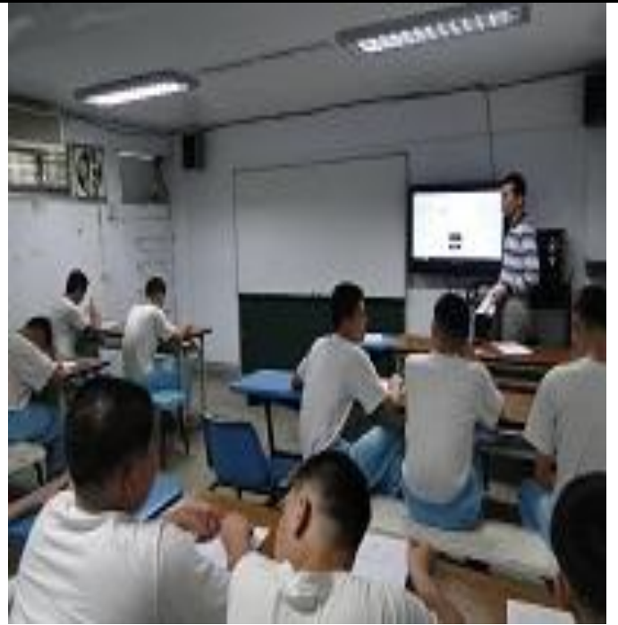
5 月份新收班宣導情形