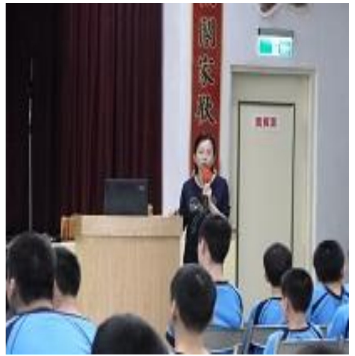
6月20日臺北市觀護協會「端午溫情滿人間」表演活動