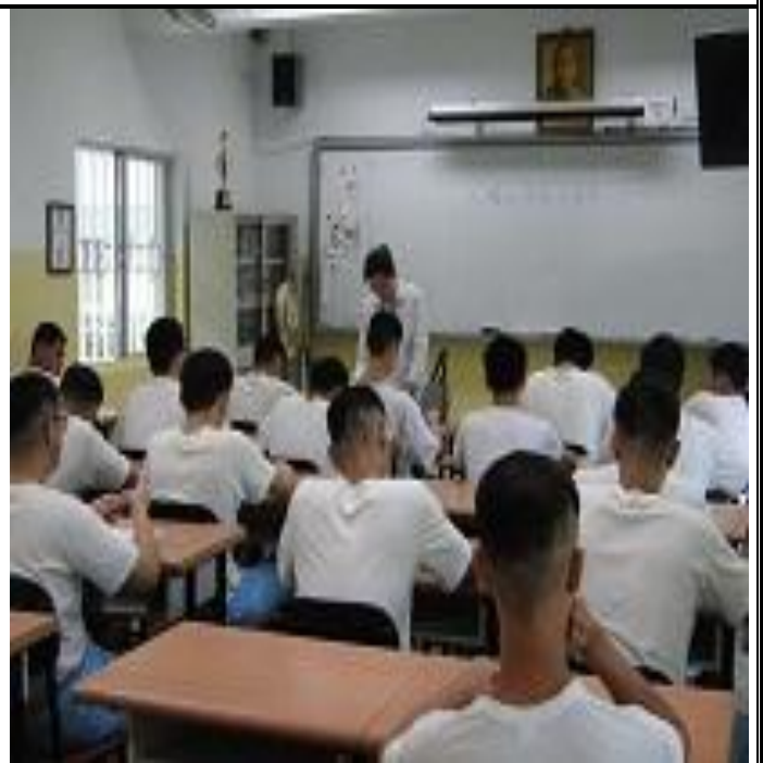
5 月份人權教育上課情形