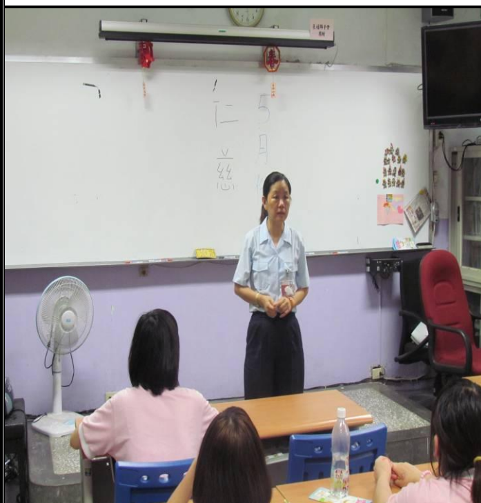
5月7日平班宣導情形