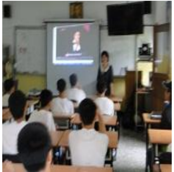
6 月份孝班上課情形