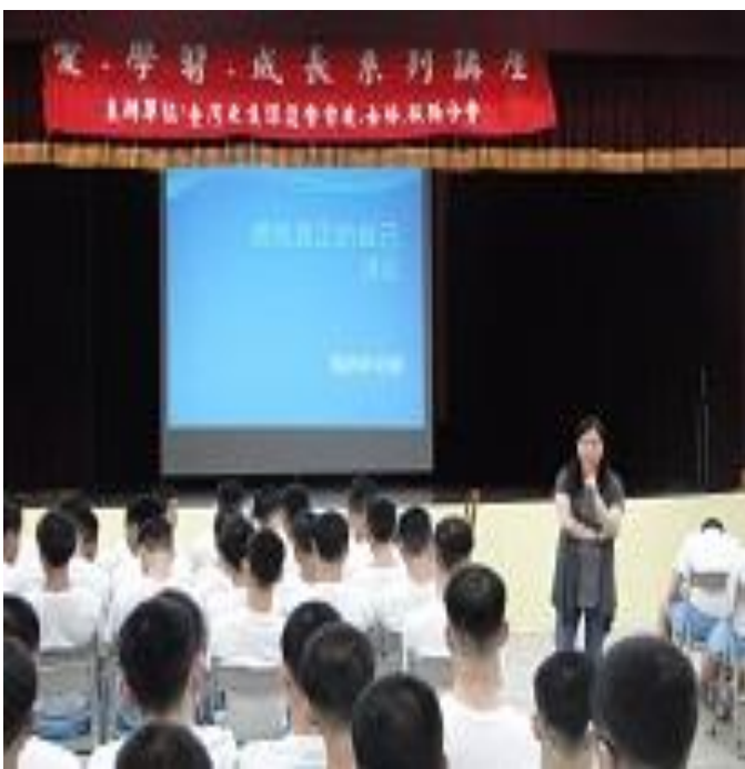
6月6日更保臺北分會「愛學習成長」專 題演講