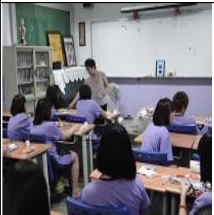
6 月份紙花班上課情形