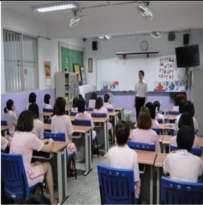
6 月份平班宣導情形