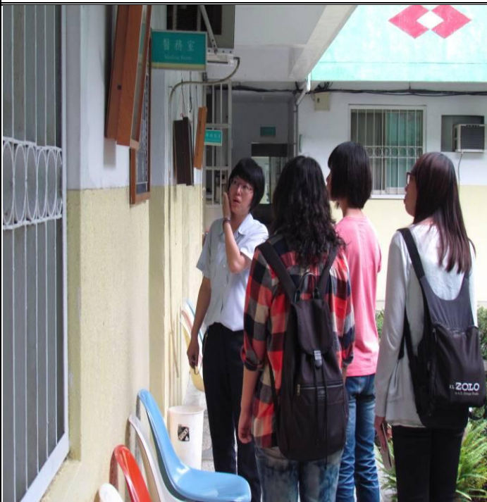
5月25日收容少年家屬暨社會人士參訪情形