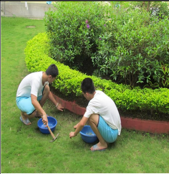
5月22日孝班收容少年整理花園之情形