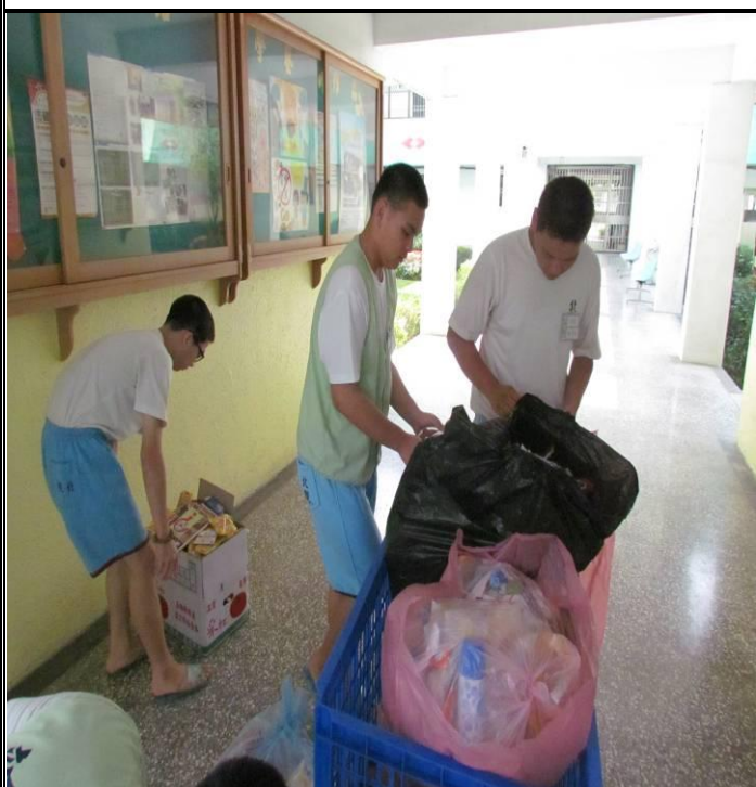
5 月份新收班收容少年資源分類情形