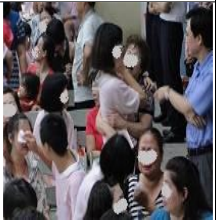
5月9日母親節面對面懇親