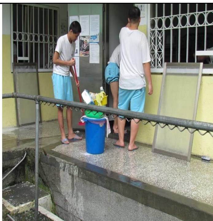
6 月 15 日孝班環境大掃除情形