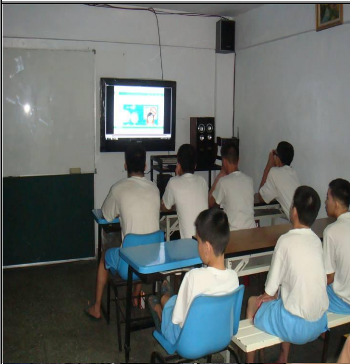
5 月 10 日新收班菸害衛教課程