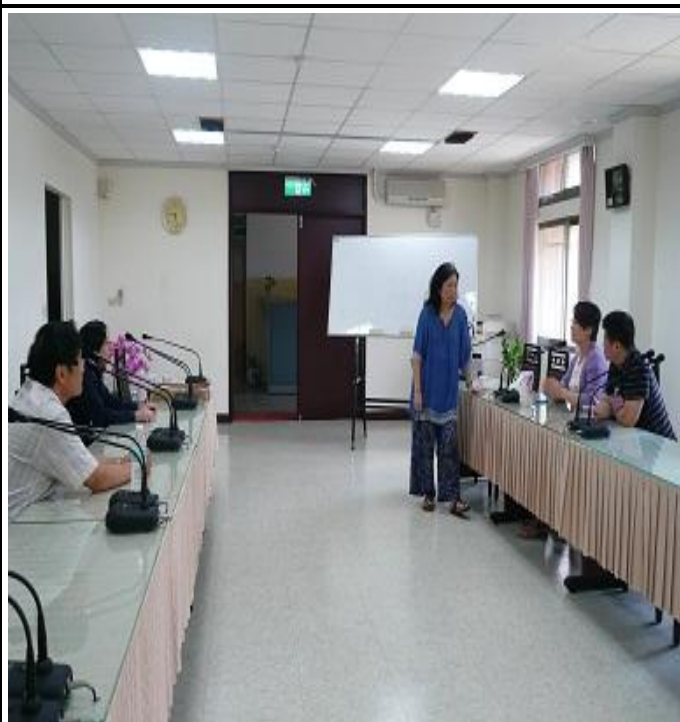
5 月份親職教育上課情形