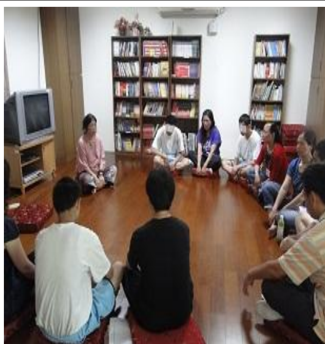
6 月份親職教育上課情形