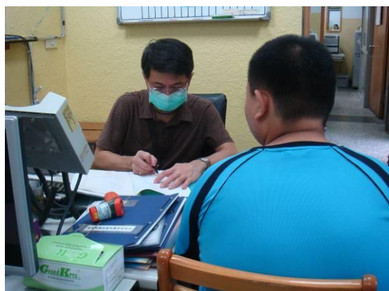
觀察勒戒醫師問診情形