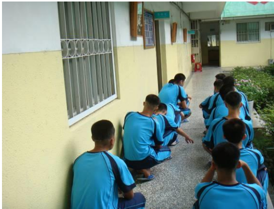
核對抽血少年名字