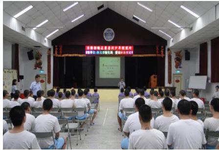
8月21日(愛滋病衛教宣導)