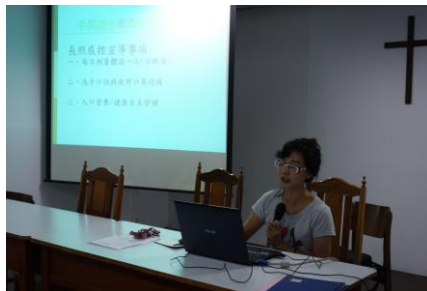
7月18.19日(職員常年教育)(長照感控)