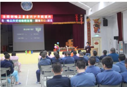
1月23日(毒品防治衛教宣導)