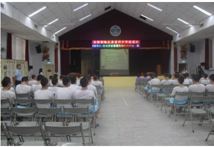
5月22日(家暴性侵衛教宣導)