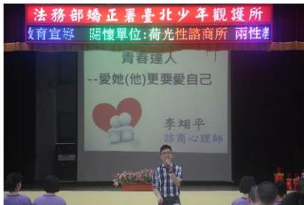
6月19日(兩性衛教宣導)