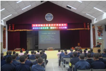
3月20日(菸害防治衛教宣導)