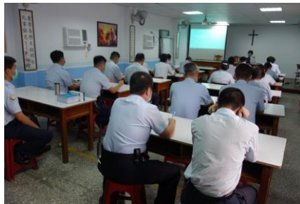
7月1日(職員常年教育)(流感防治)