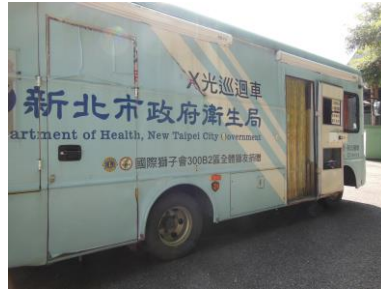
8月14日職員胸部X光篩檢