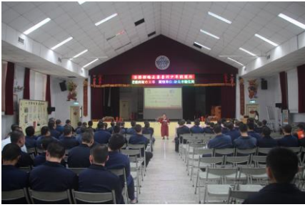
2月20日(愛滋病防治衛教宣導)