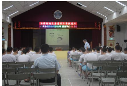
4月24日(登革熱防治衛教宣導)