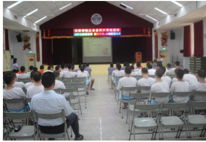
9月25日(流感防治衛教宣導)