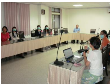
7月2日(職員常年教育)(流感防治)