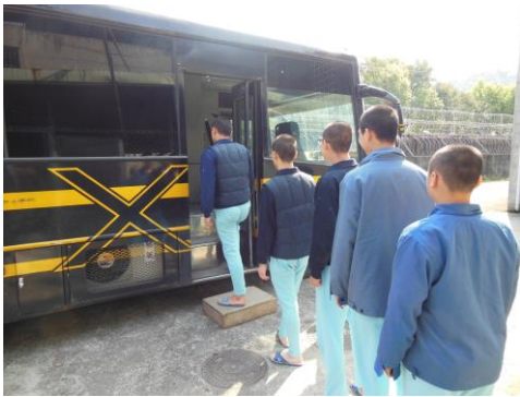
圖一 確認篩檢名冊