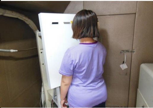
圖一 確認篩檢名冊