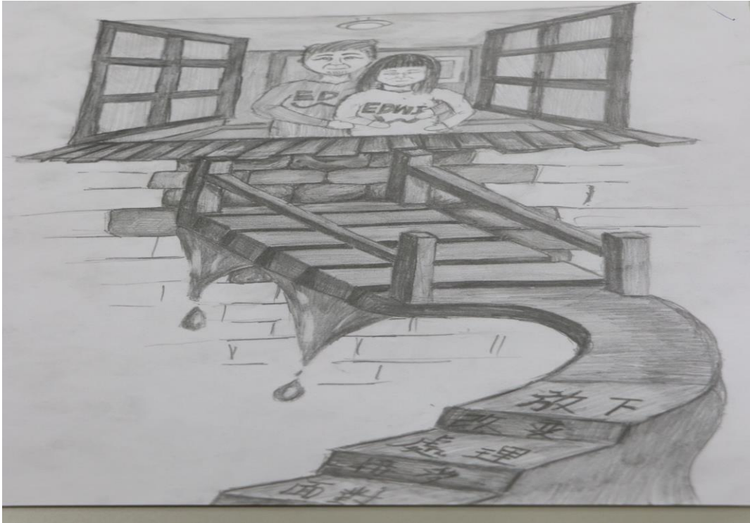
小華面對自己的難關——突破，擁抱父母