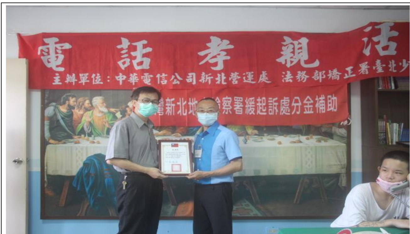
中華電信新北營運處提供 15 線電話供收容少年撥打