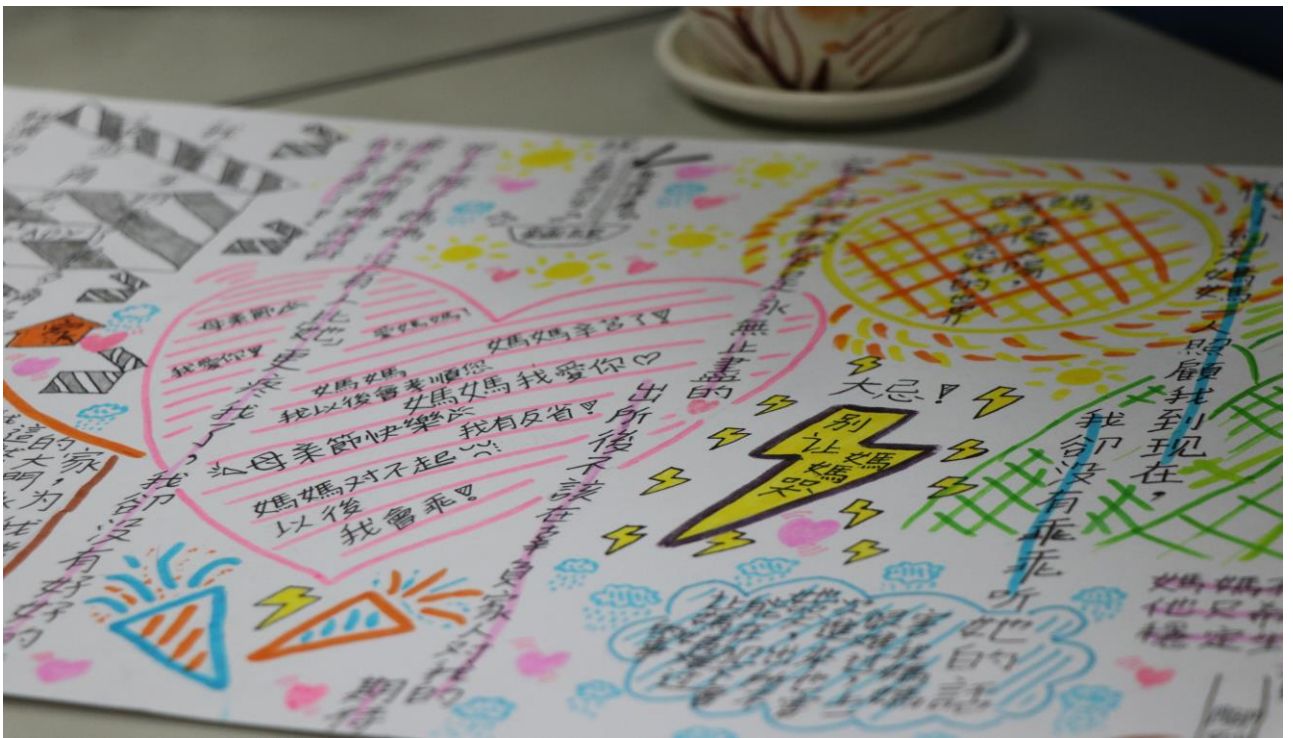
阿龍想對母親不好意思開口的話都寫進圖畫裡