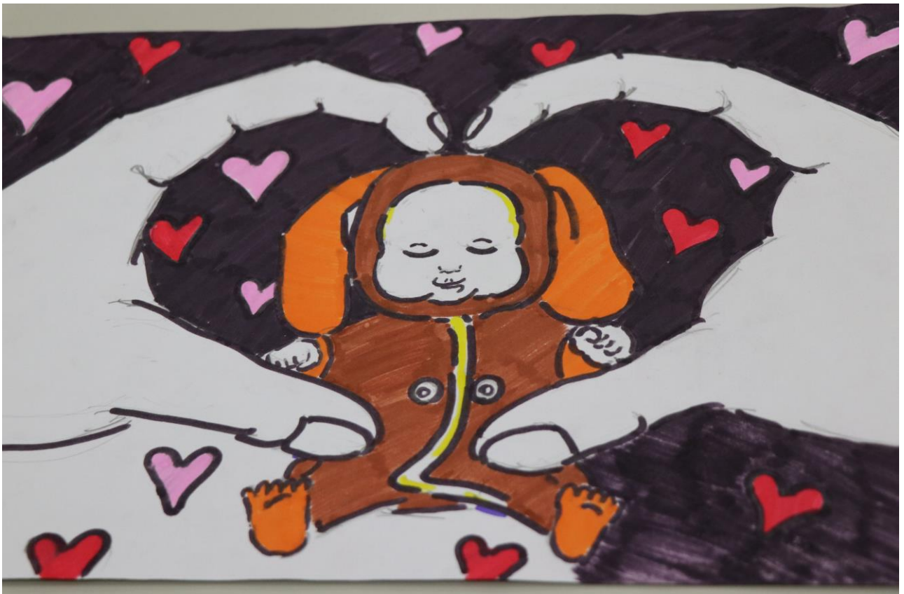
阿義回憶自幼在媽媽的細心呵護下逐漸長大