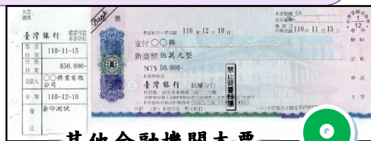
其他金融機關本票