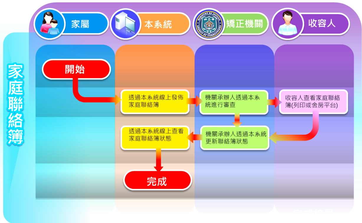
圖 1-1：電子家庭聯絡簿流程

電子「家庭聯絡簿」提供家屬與收容人溝通的平台，家屬可透過此功能發佈照片或留言，發佈的內容需經由機關派員審核後才交由收容人查閱。