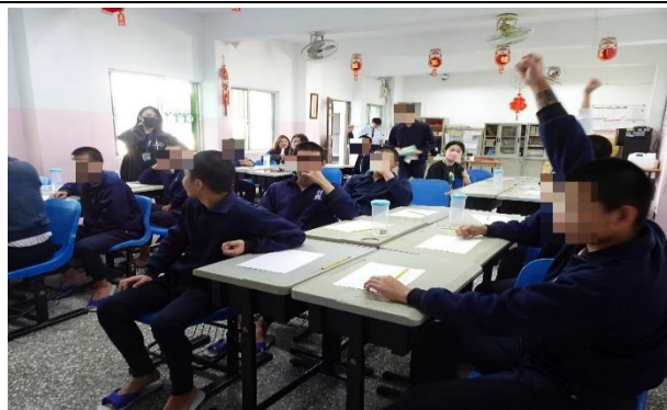
老師分享經驗與少年互動